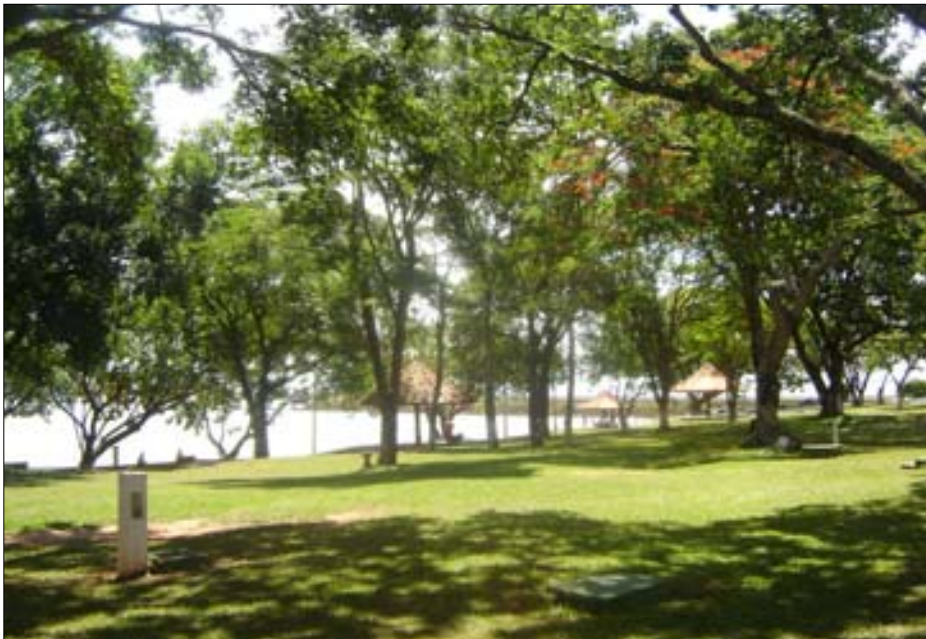
A expectativa é de que um grande número de visitantes passe pelo Camping nesta época do ano