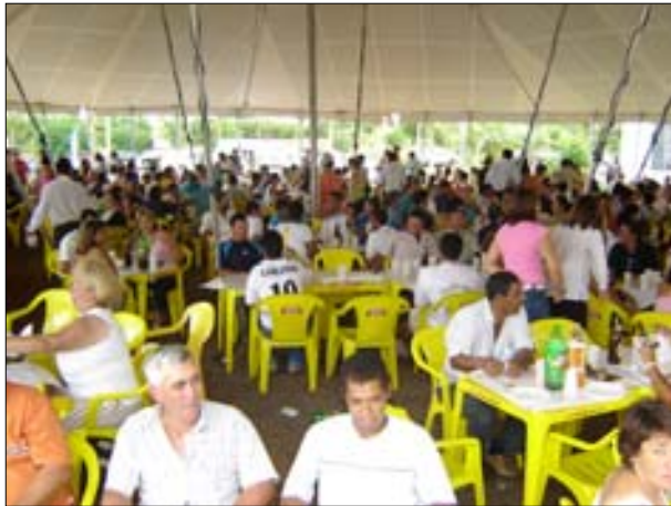
Festa do dia 23 de dezembro contou com cerca de 2 mil pessoas

Durante 2005 o funcionalismo municipal obteve várias conquistas, como a melhora na qualidade dos produtos da cesta básica que está sendo entregue em dia e na casa do funcionário,