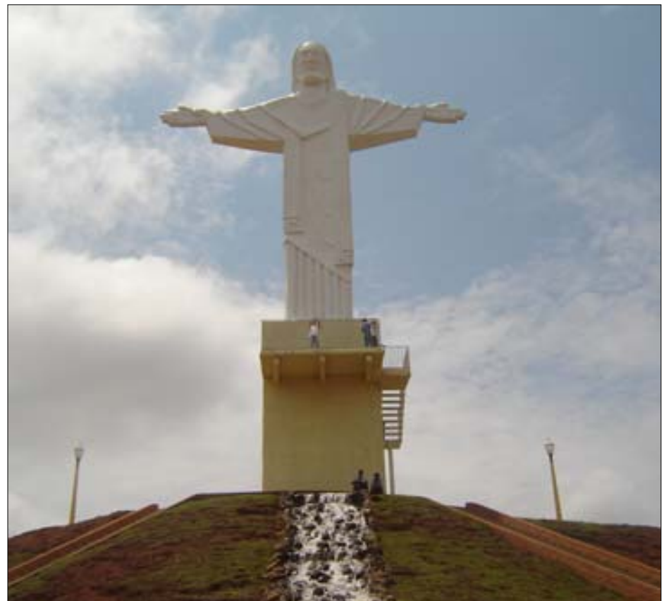
Cristo Redentor volta a ser o marco da passagem do ano em

A tradicional queima de fogos na passagem de ano volta a ser realizada na Praça do Cristo Redentor. A última vez em que houve show pirotécnico no local foi na passagem