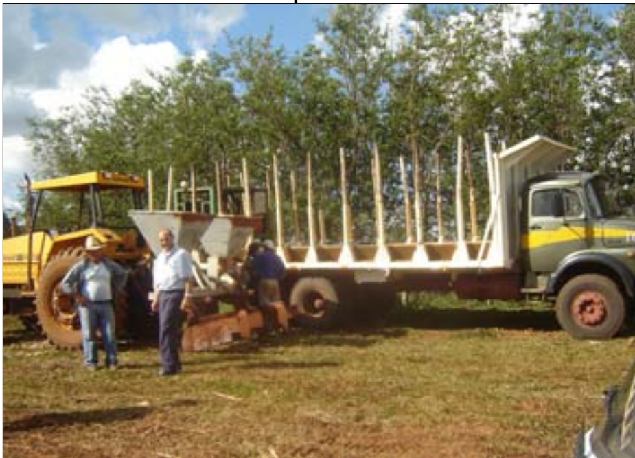
Diversos veículos e equipamentos da empresa estão trabalhando no local