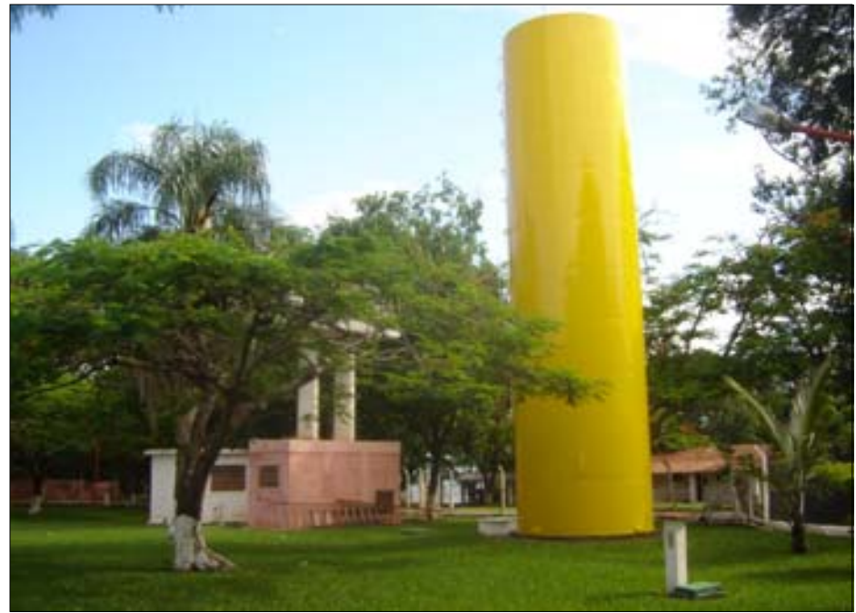
Diversas melhorias foram feitas no local