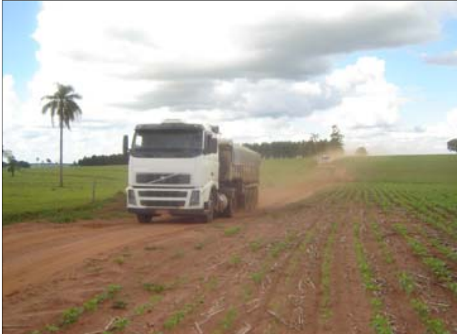
Desde a semana passada os trabalhos no local estão

A empresa da família Furlan deverá abrir nos próximos dias um escritório em Avaré para começar a contratar funcionários e mão de obra, já que serão necessá-