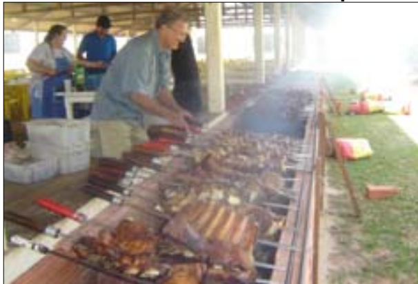
Quem compareceu na festa do dia 23, realizada na APAE, pôde saborear um delicioso churrasco