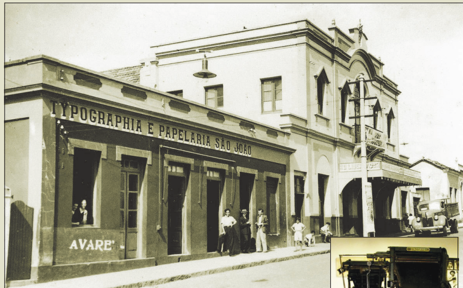
Primeira sede do Jornal O Avaré ao lado do Cine Santa Cruz

Com a instauração do Estado Novo, "O Avaré" corre o risco de ser fechado. Porém, lideranças co-