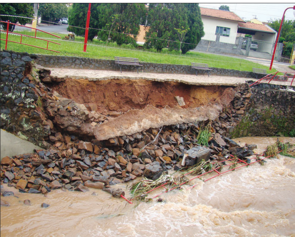
Muro de arrimo da Praça Brasil-Japão destruído pelas chuvas