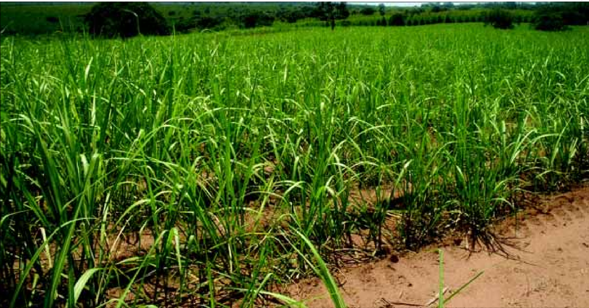
Plantação de cana-de-açúcar

O município da Estância Turística de Avaré já vem se beneficiando com a instalação e funcionamento da usina de açúcar e álcool, pois veio oferecer números altamente significativos na geração de mão-de-obra, contribuindo de forma grandiosa com a melhoria da qualidade de vida