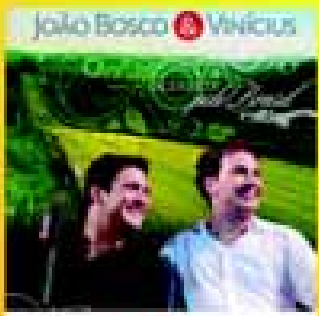
dia 12 Sex.