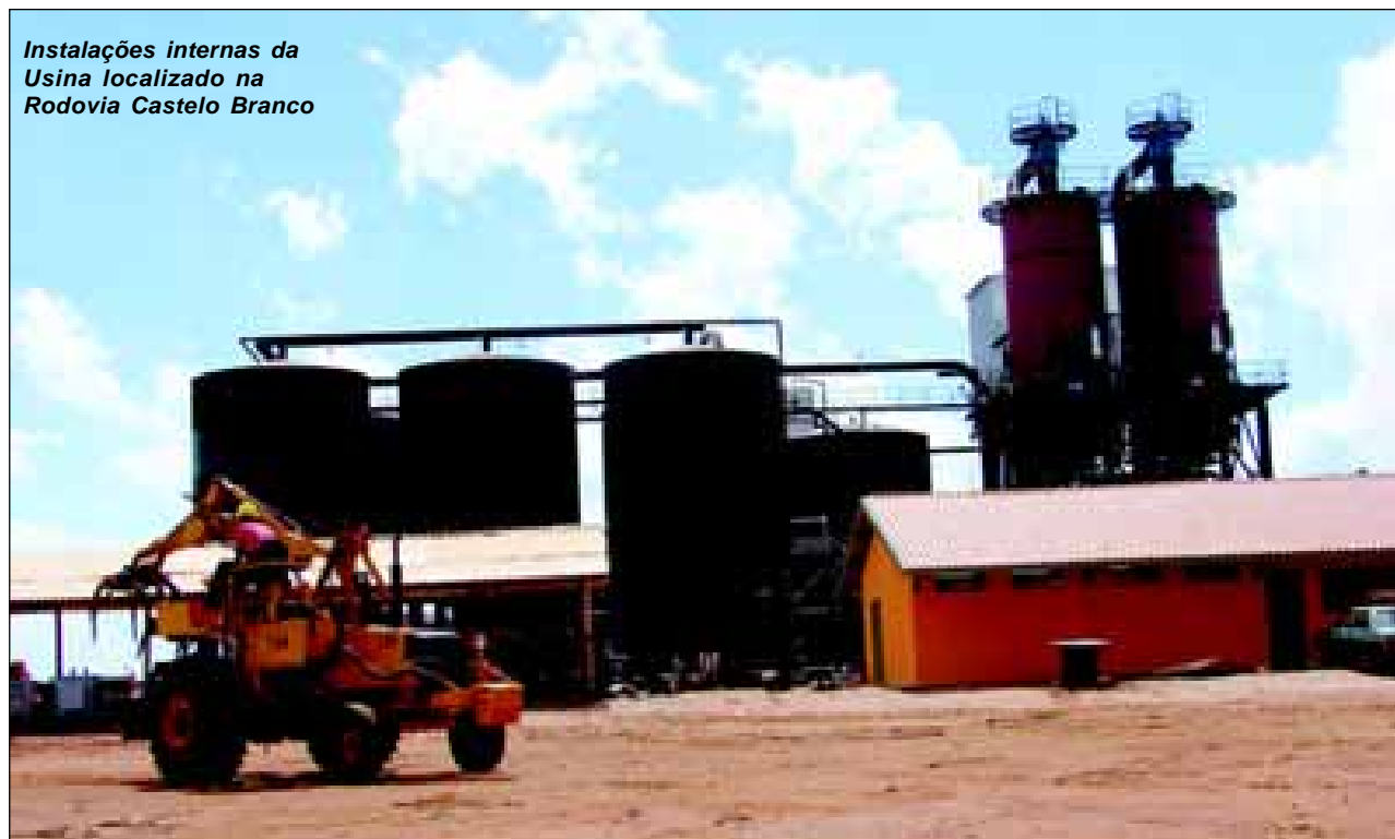
Instalações internas da Usina localizado na Rodovia Castelo Branco

Retire gratuitamente o Semanário Oficial da Estância Turística de Avaré no Paço Municipal, Centro Administrativo e nas Bancas de Jornais