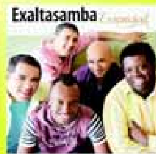
dia 10 Qua.