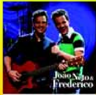
dia 13 Sáb.