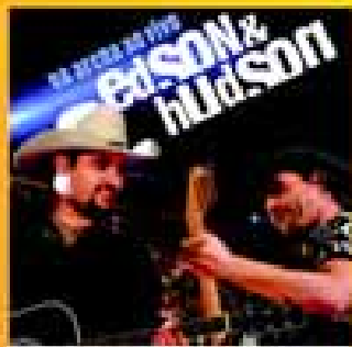
dia 11 Qui.