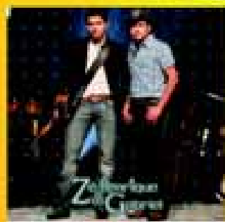
dia 06 Sáb.

Emocionantes Shows da 8º Fest Country 2008