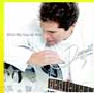
dia 14 Dom.

ENTRADA FRANCA PARQUE DE DIVERSÕES EXPOSIÇÃO DE EQUINOS E OVINOS QUEIMA DE FOGOS PRAÇA DE ALIMENTAÇÃO EXIBIÇÃO GRATUITA BAILÃO TRADIÇÃO CAVALGADA 10h às 18h 07 Dez. / Dom.