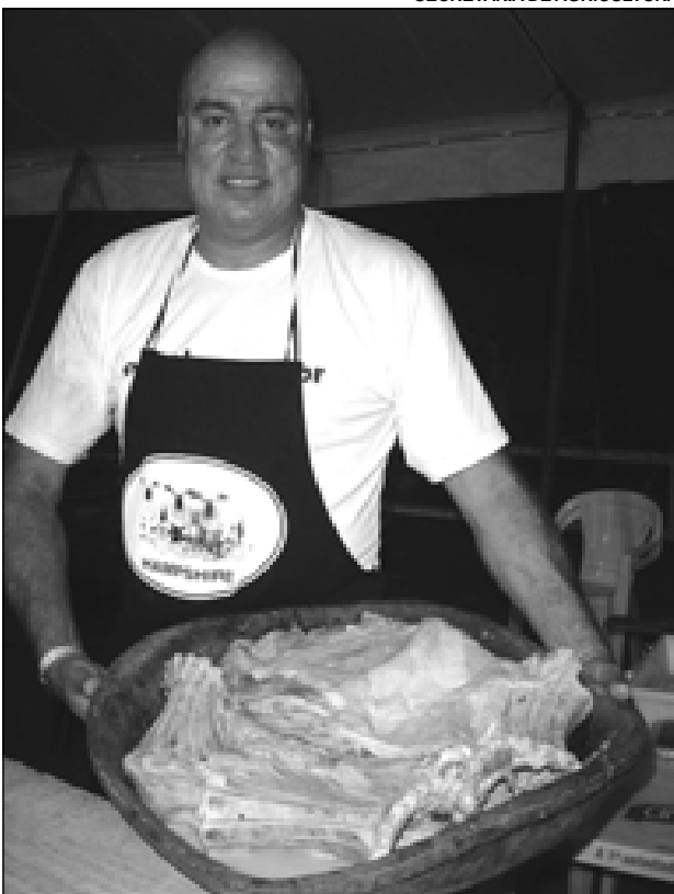
Nami, da Fazenda Grama Roxa (Avaré), durante a Queima do Cordeiro na Expovelha 2007

Durante a 8ª Fest Country, que acontece de 6 a 14 de dezembro no Parque de Exposições de Avaré, ocorre a 2ª Ovino Fest 2008, evento que tem apoio da Prefeitura da Estância Turística de Avaré através da Secretaria Municipal da Agricultura e Abastecimento (SMAA).