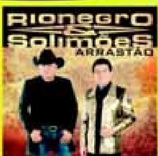
dia 07 Dom.