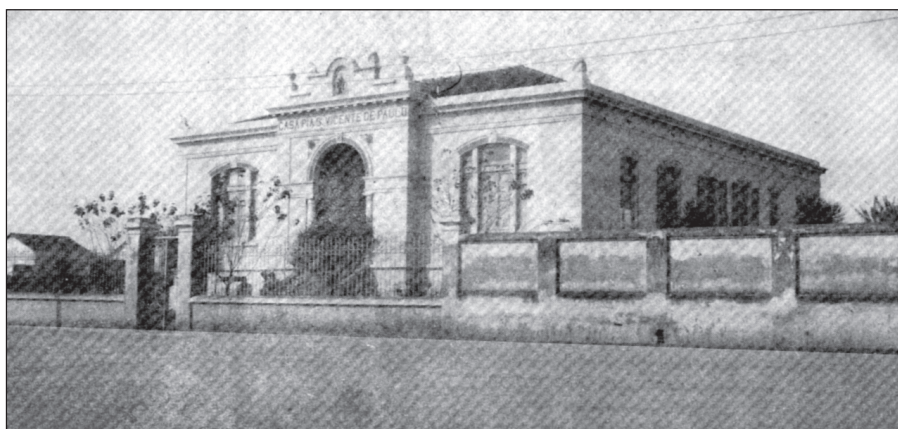
Casa Pia de São Vicente de Paulo, antigo hospital, 1913