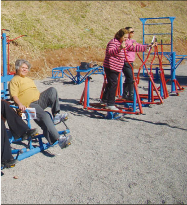
... livre para a terceira idade

ESF Cecílio Jorge Netto, na Rua Benedito Ailton Camilo de Souza, 212; O 34º Campeonato Nacional da Raça Quarto de Milha – ABQM – teve início no último dia 15 e segue até o dia 24 de julho no Parque Fernando Cruz Pimentel; No dia 27, às 9h00, tem