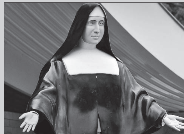
Estátua de Madre Paulina em Nova Trento (SC)

Paulina transferiu-se para São Paulo. Atenta e compassiva, amparou velhos ex-escravos, os quais ficaram marginalizados após a Lei Áurea, gerando grave problema social. Passou a ajudar idosos e doentes no interior.