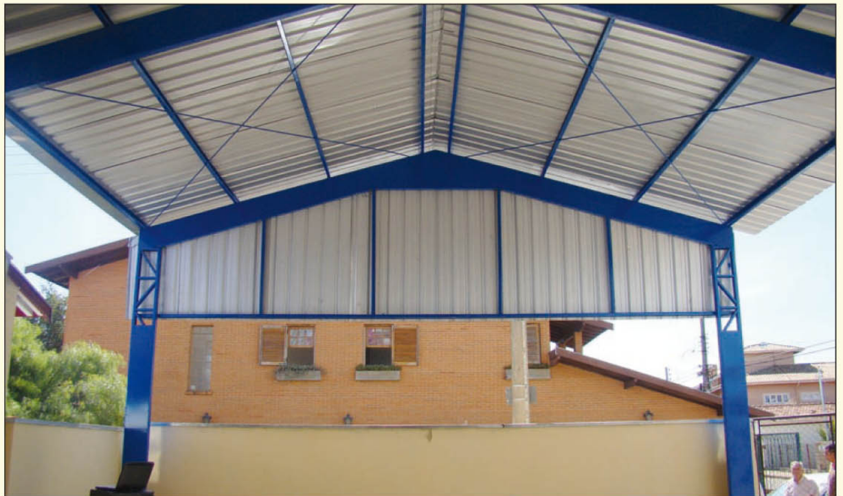
Inauguração da cobertura do pátio da EMEB Alzira Pavão