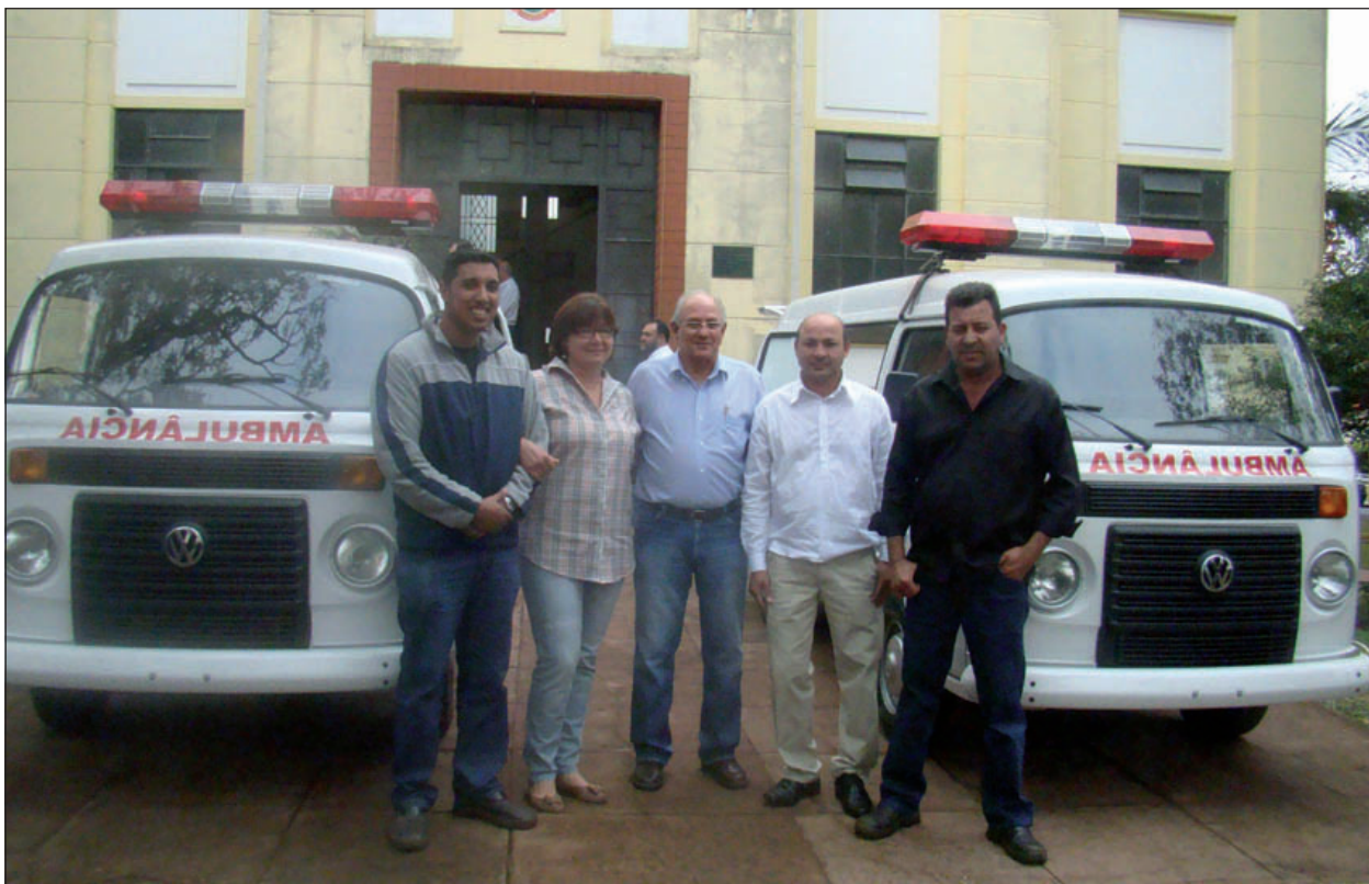
Coordenador e funcionários da Usina Furlan durante a entrega

Durante a entrega, também foi anunciado que a frota contará, ainda este ano, com mais 4 ambulâncias zero Km, sendo duas provenientes do SAMU, que já estarão à disposição da população na 1ª semana de setembro e duas ambulâncias adquiridas junto ao Governo do Estado, com previsão de entrega para o mês de outubro.