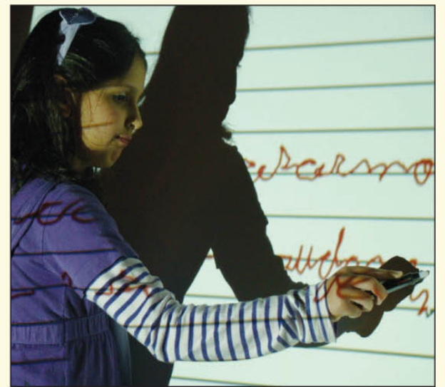
Inauguração de uma das 22 lousas digitais