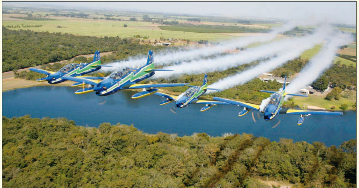
Apresentação da Esquadilha da Fumaça será no dia 31 de julho