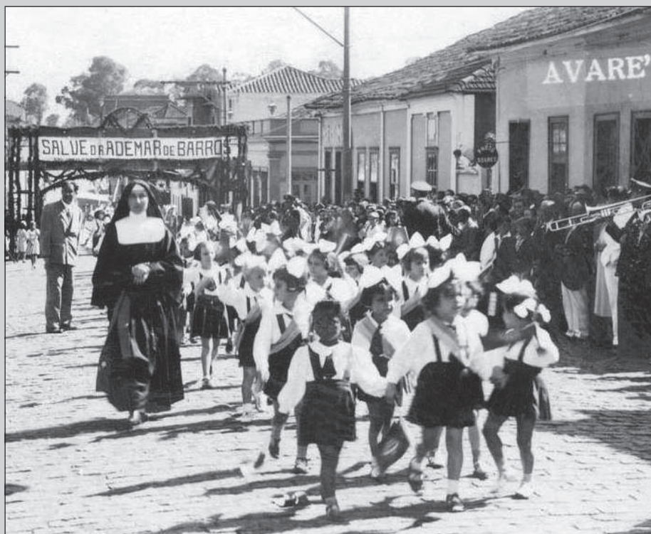
Irmãzinha num desfile festivo em Avaré, 1940

Em 1938, contudo, teve início a sua “via crucis” com grandes provações físicas. Debilitada pelo diabetes, teve o braço direito amputado e, aos poucos, perdeu a visão. Quatro anos depois, a 9 de julho de 1942, morre aos 76 anos, em São Paulo. Beatificada pelo Papa João Paulo II em 18 de outubro de 1991, em Florianópolis (SC), foi por ele canonizada em 19 de maio de 2002, em Roma.