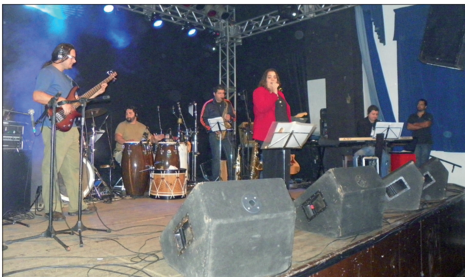
Fampopinha divulga lista de músicas classificadas

A eliminatória avareense é uma porta de entrada para os músicos de Avaré e região participarem do maior e melhor festival de música do país, a FAMPOP – Feira Avareense de Música Popular -, festival que revelou nomes como Jorge Vercillo, Chico César, Lenine, Zeca Baleiro, entre outros.