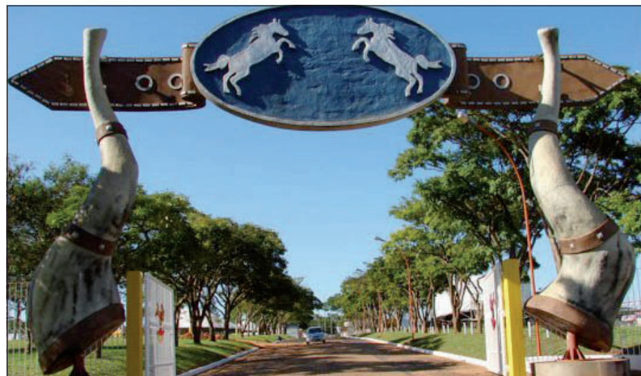
Entrada do Parque de Exposições Dr. Fernando Cruz Pimentel