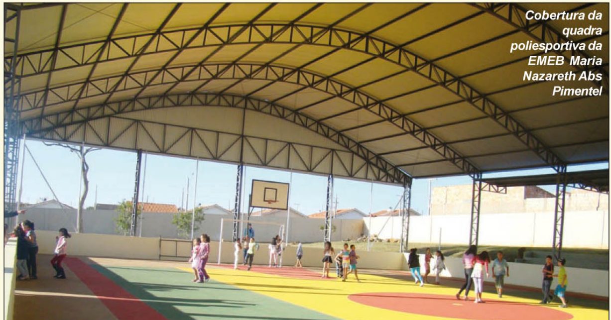
Cobertura da quadra poliesportiva da EMEB Maria Nazareth Abs Pimentel