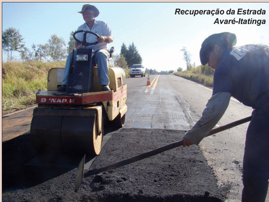
Recuperação da Estrada Avaré-Itatinga

gados em um dos maiores projetos de recuperação de vias, urbana e rural, já realizados no município. Página 11.