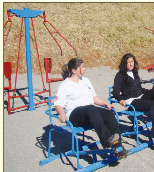
Entrega de academia ao ar livre

No dia 14, 15 aconteceu a fase avareense da 29ª Feira Avareense da Música Popular – FAMPOP -, no Anfiteatro da FREA. No dia 16, se apresentaram as músicas da região. Dia 19 de julho foi a data escolhida para contemplar o município com entrega de academias ao ar livre, às 9h30, ao lado da pista de Skate “José