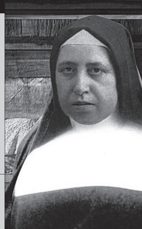
Santa Madre Paulina (1865- 1942)

Por mais de 70 anos, até meados de 2009, a congregação de Santa Paulina atuou dinamicamente nas áreas de saúde e educação, deixando aos avareenses valioso legado de espiritualidade e solidariedade.