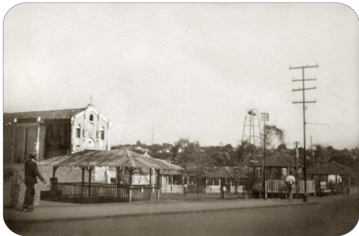
A Capela São Benedito em foto de 1942

Como a comunidade de fiéis havia crescido, o arcebispo de Botucatu, dom Henrique Golland Trindade reorganizou a Igreja Católica no município com a criação da segunda paróquia em 13 de março de 1960. Nessa época, além do arjardimento, o Largo São Benedito recebeu como ornamentação mosaico artístico no seu piso.