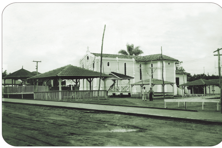
A antiga capela vista pela Rua Mato Grosso.