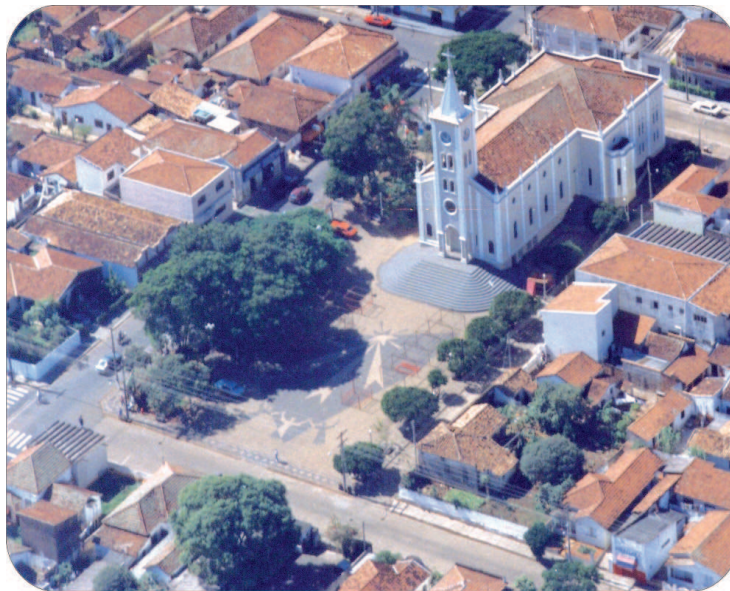
Panorâmica da praça em 1994.