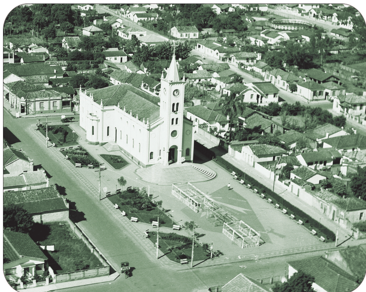
Vista aérea do Largo São Benedito, 1964.