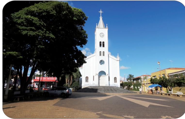
O Largo São Benedito visto pelo mesmo ângulo em 1974 e na atualidade