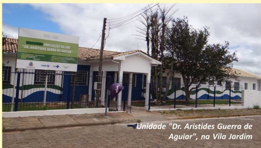
Unidade "Dr. Aristides Guerra de Aguiar", na Vila Jardim

Já a UBS "Dr. Aristides Guerra de Aguiar" (Vila Jardim) ocupava uma área de 371,63 m 2 . Ampliada em 159,80 m 2 a unidade passou a dispor de um Centro de Fisioterapia remodelado, equipado e com acessibilidade. Nas duas obras a Prefeitura investiu mais de R$ 468 mil.