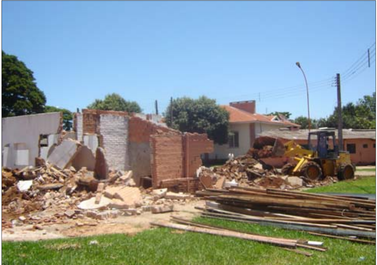
Nesta semana começou o trabalho de demolição do prédio que abrigava a sede da UNA

Desta forma o Recinto da Emapa receberá futuramente novas instalações, mais modernas e estará dotado de completa infra-estrutura. Hoje o Recinto da Emapa é um dos melhores parques de exposições do país e pretende melhorar ainda mais esse atendimento para poder receber grandes eventos, gerando assim mais renda para o município.