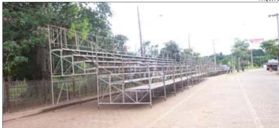
Como no Carnaval do ano passado, a Avenida Major Rangel receberá 300 metros de arquibancada

Para a realização do carnaval de rua será montada uma grande estrutura na Avenida Major Rangel, com