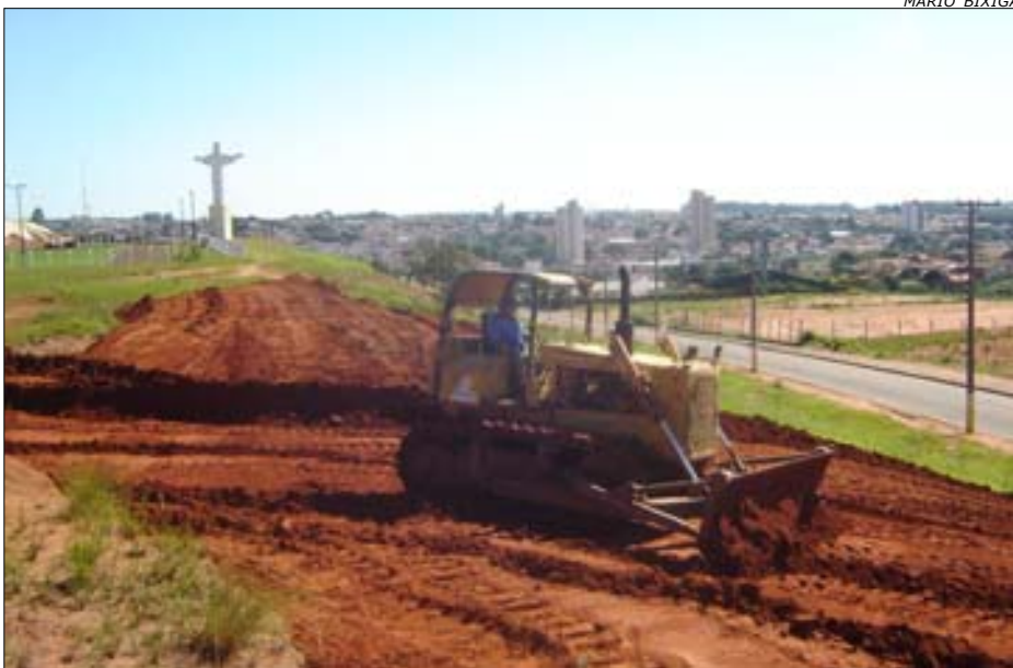
A nova via fará a ligação das ruas Carmem Dias Farias e Três

A Prefeitura da Estância Turística de Avaré está providenciando a abertura de uma nova rua que possibilitará um melhor acesso aos moradores do Alto da Boa Vista e Três Marias.