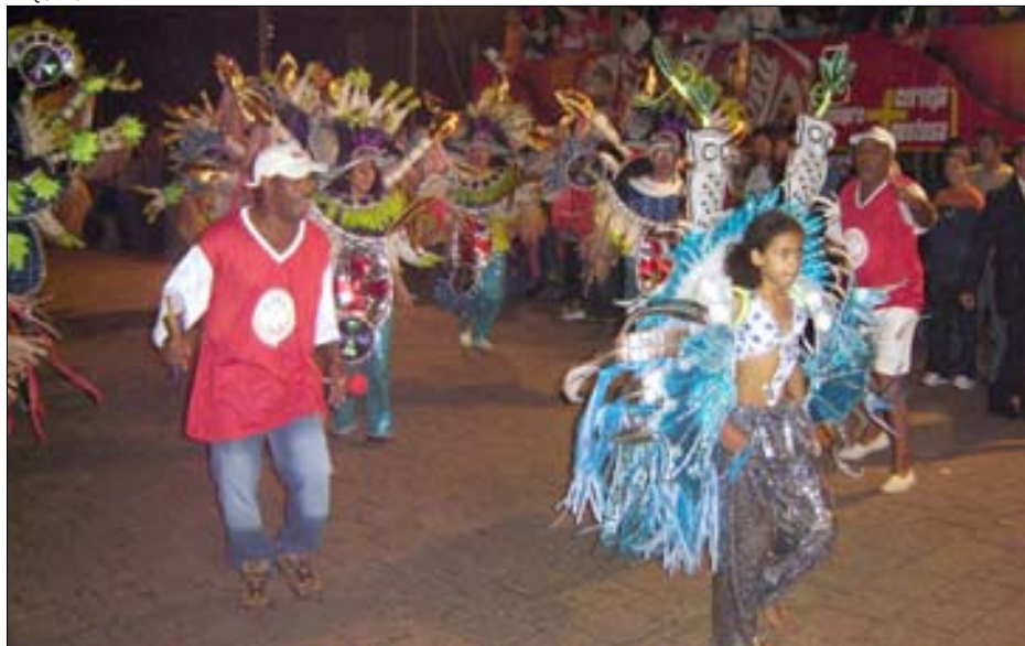
Carnaval de Rua terá a apresentação das escolas de samba Tradição, Mocidade Avareense, UNA e Água da Onça

A Prefeitura da Estância Turística de Avaré já deu início aos preparativos para o Carnaval deste ano. Este será um dos melhores carnavais dos últimos anos, já que a preparação começou com certa antecedência.