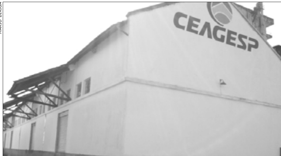
Para utilizar o Barracão, o produtor deverá fazer parte de uma associação

Anjos e Demônios – Dan Brown Fortaleza Digital – Dan Brown Código Da Vinci – Dan Brown O Terceiro Gêmeo – Ken Follet