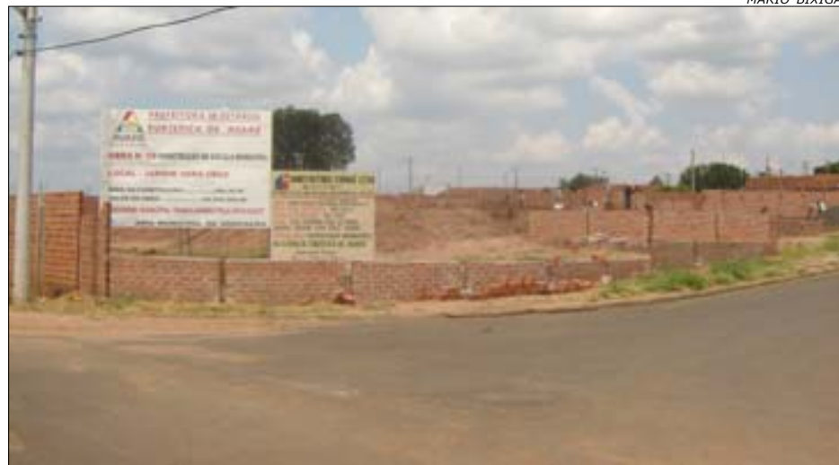
A área está praticamente toda murada