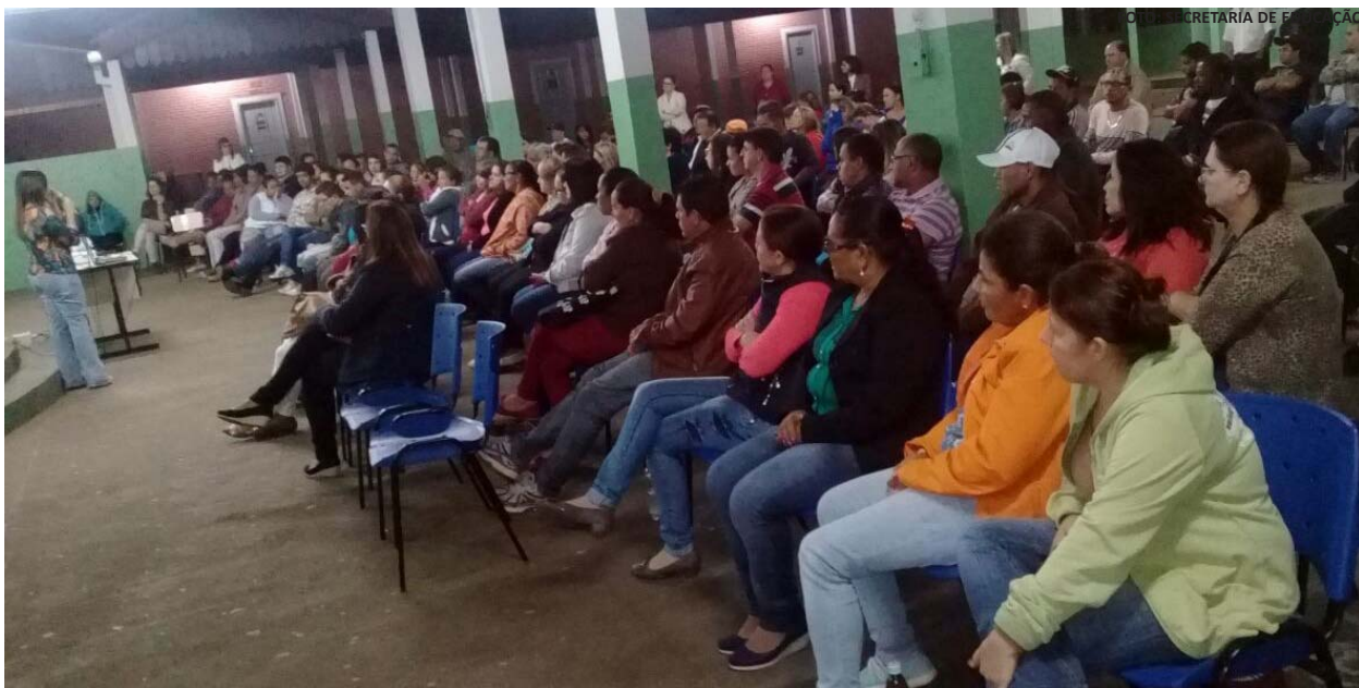
Plateia composta por alunos e equipe pedagógica