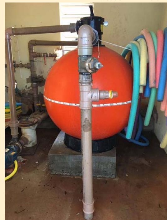
Motor da Piscina