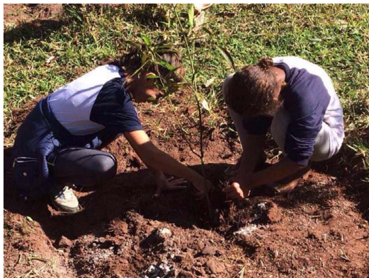
Crianças realizam plantio de árvores nativas

Com apoio de uma sala da Escola Municipal Orlando Cortez, marcada pela presença de alunos entre 10 a 12 anos. As crianças, além de participarem do evento, também tiveram algumas atividades como forma de incentivar as boas práticas para o meio ambiente. Des-