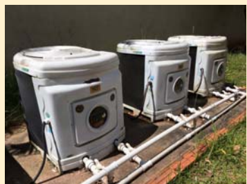
Aquecedores da Piscina

Serviço Secretaria Municipal de Esportes e Lazer Rua: Anacleto Pires s/nº – Vila Três Marias Telefone: 3732-0756 Horário: das 7h às 22h