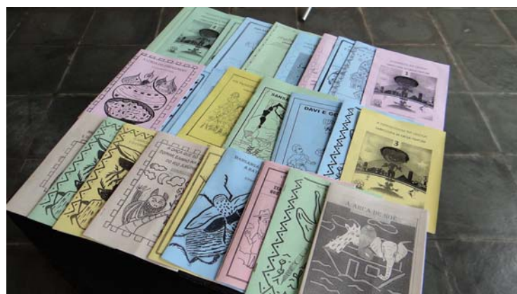
Obras de Maurício de Barros