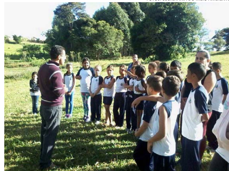
Alunos da Escola Municipal Orlando Cortez

Sabesp (Companhia de Saneamento Básico do Estado de São Paulo), da Polícia Ambiental, Prefeito e municípios.