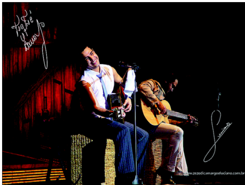
Zezé di Camargo e Luciano

No dia 5 (terça-feira) acontece a apresentação da dupla André e Matheus. No dia 6 (quarta-feira) a atração da festa será César Menotti e Fabiano. Na quinta-feira (dia 7) o público presente poderá acompanhar o show de Guilherme e Santiago. Na sexta-feira (dia 8) acontece o show com Rio Negro e Solimões. No sábado (dia 9) quem se apresenta é o cantor Leonardo. O encerramento da festa, no domingo (dia 10) será com a dupla Zezé di Camargo e Luciano.