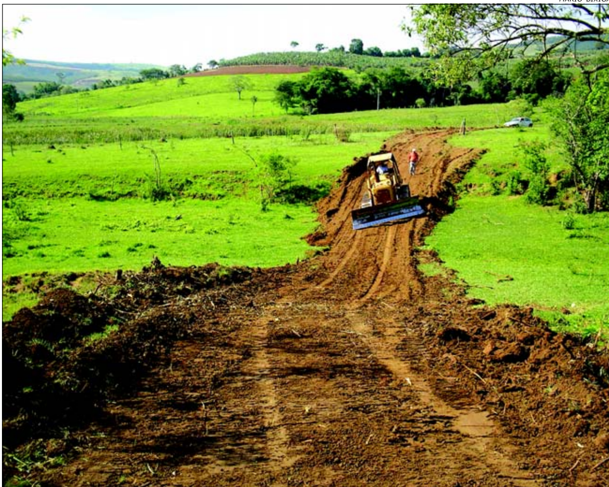
Estrada está sendo aberta no bairro Jacutinga

O objetivo dos trabalhos é padronizar o tipo de piso ao existente no restante da praça, criando assim uma nova característica urbana, bem como dar novo embelezamento para o espaço público ao redor da igreja tão frequentado pelos fiéis e pela população.