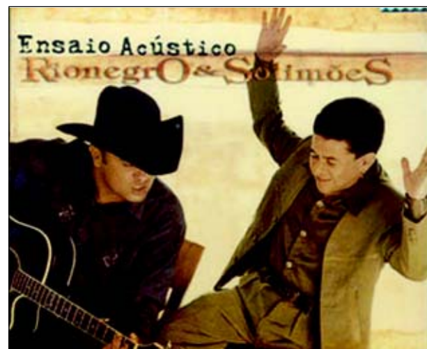
Rio Negro e Solimões