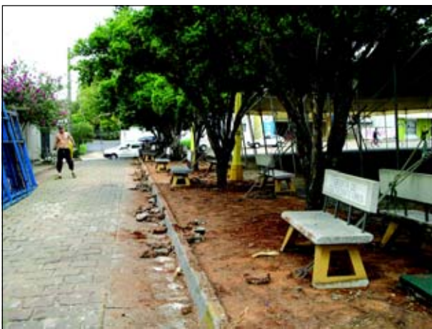
No lugar do antigo calçamento será colocado mosaico português

A Prefeitura da Estância Turística de Avaré está executando a retirada de lajotas do Largo São Benedito. No local será implanta cal-