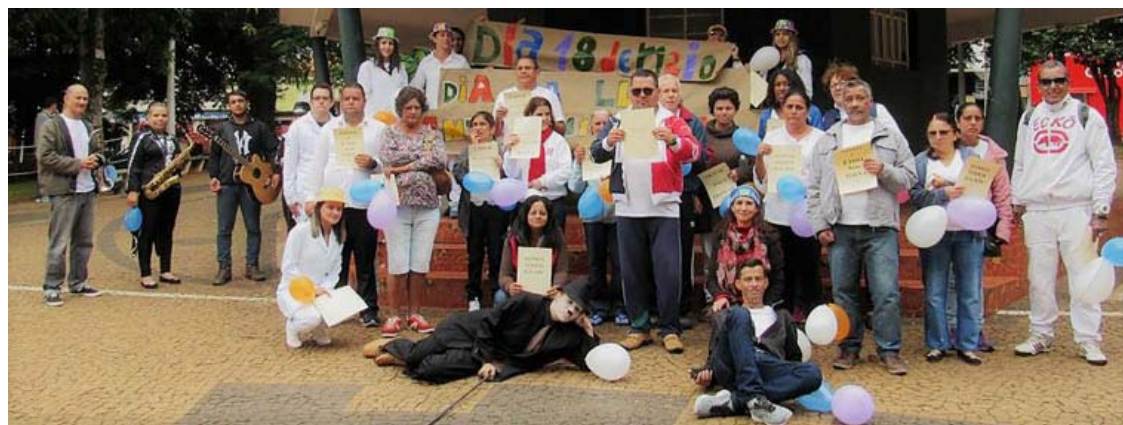
Integrantes expõem cartaz no Dia da Luta Antimanicomial

Nestas ações, o CAPS desenvolve projetos inter-