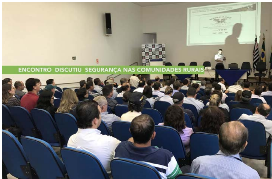
ENCONTRO DISCUTIU SEGURANÇA NAS COMUNIDADES RURAIS