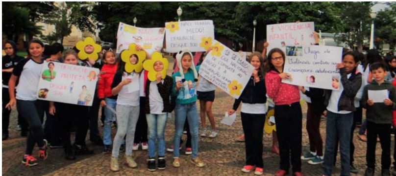
"Não à violência infantil!"

Na manhã da última quinta-feira, 18, em comemoração ao Dia Nacional de Combate ao Abuso e à Exploração Sexual Contra Crianças e Adolescentes, em parceria com a Secretaria Municipal da Educação, alunos e professores realizaram uma passeata para contestar as injustiças, que