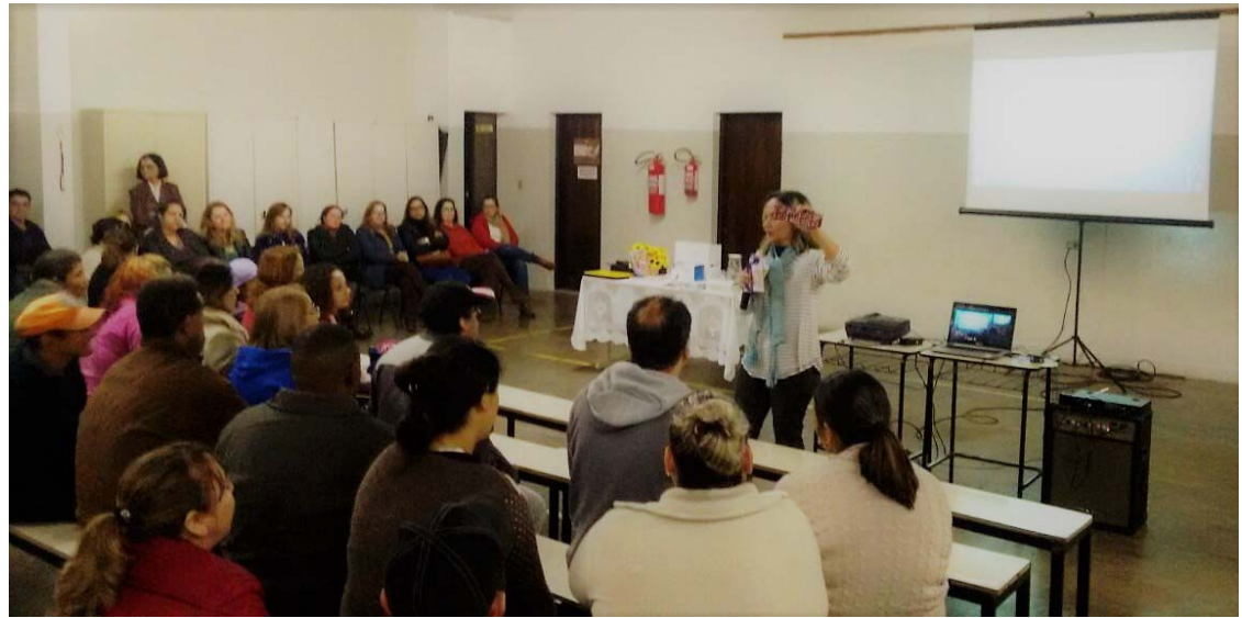
Especialista explica sobre o assunto e interage com os alunos

"Aprimorar conteúdo e contextualizar debates através de momentos reflexivos ou comemorativos são maneiras de trazer, harmonizar e implementar a educação em suas diversas formas", salienta a profissional.