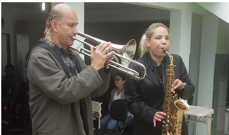
Show com o dueto de saxofone e trombone

O 'Centro de Atenção Psicossocial (CAPS II) Espaço Renascer' é um serviço que tem por objetivo oferecer tratamentos, atividades e orientações para acolher cidadãos, que possuem problemas relacionados ao Álcool e as Drogas (AD), como, também, recebe usuários mentalmente saudáveis, ausentes de transtornos mentais.