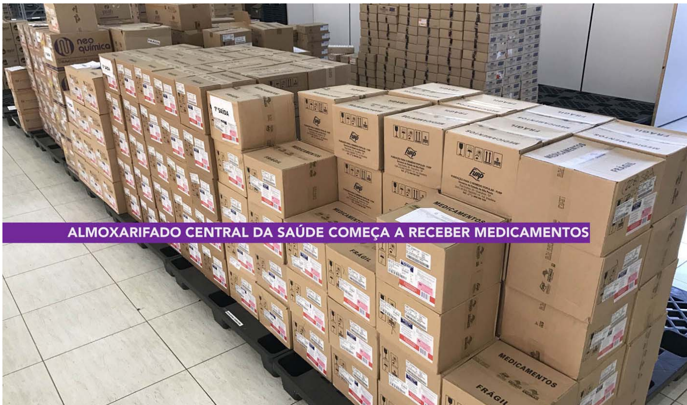
ALMOXARIFADO CENTRAL DA SAÚDE COMEÇA A RECEBER MEDICAMENTOS