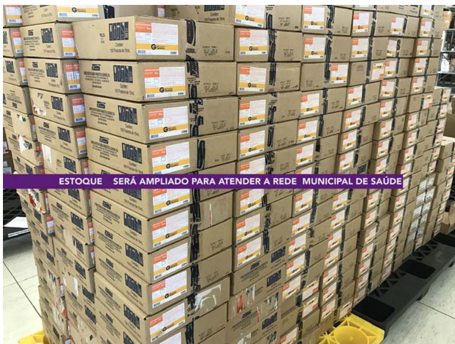
ESTOQUE SERÁ AMPLIADO PARA ATENDER A REDE MUNICIPAL DE SAÚDE

Na última quinta-feira, 25, o Almoarifado Central da Secretaria de Saúde recebeu um grande volume de medicamentos e insumos que serão distribuídos para atender a Rede de Saúde da Prefeitura de Avaré.