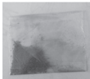
Imagem 4 Reboco parede lateral esquerda

Verificou-se também que essa camada de reboco estava granulosa e apresentava esfacelamento fácil, foi retirada amostra para análise.