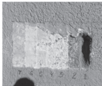
Imagem 5 Abertura estratigráfica 1

Logo acima dela, há uma camada de massa fina branca (massa corrida ou gesso (janela 2) e, a partir daí, decorrem quatro camadas de cores: dois tons de salmão e 5) (janelas, um amarelo claro (janela 6) e branco (3)