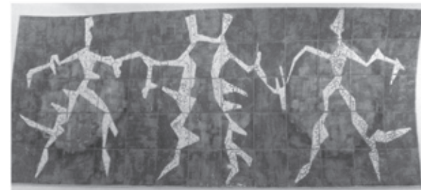
Imagem 1 Painéis cerâmicos K. Pilsher

As faixas de acabamento e a laje escalonada em balanço tem revestimento de pastilha da cor cinza claro, hoje sob várias camadas de repinturas.