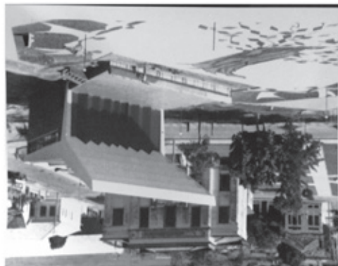
Imagem 2 Foto de 1959, sem os painéis cerâmicos

Sendo assim, o exemplar da Concha Acústica presente na cidade é um símbolo de modernidade, de extrema importância por colocar a cidade e os cidadãos da época no clima do que de mais moderno se fazia no Brasil e no mundo, lembrando que estamos falando da época da inauguração de Brasília, símbolo máximo de modernidade e progresso de então.