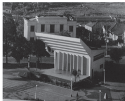
Imagem 3 foto de c.1963 com os painéis de Karoly Pichler