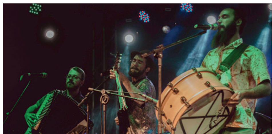
Banda Corda Crua