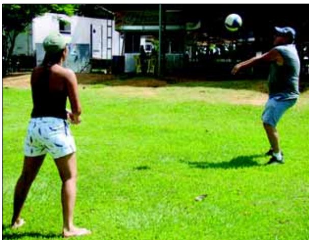
Práticas esportivas foram realizadas no Camping