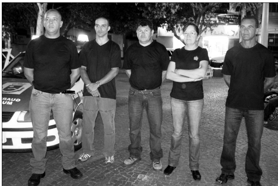
Parte dos componentes da Guarda Municipal

De acordo com o Artigo 2º do Projeto de Lei aprovado, compete à Guarda Municipal promover dia e noite a vigilância dos logradouros públicos, o que inclui praças e jardins, monumentos his-