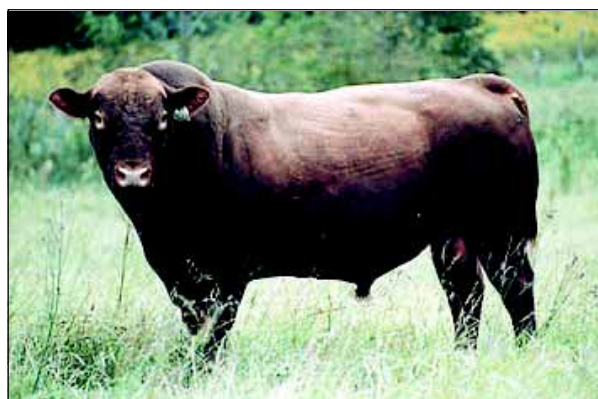
A mostra vai receber a raça Angus entre os dias 8 e 14

“Leilão União do Brasil / Taquari e Convidados” com a venda de reprodutores e matrizes PO, bezerras de cruzamento industrial e receptoras.