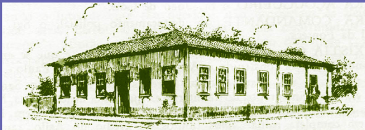
Colégio Azurara, 1886