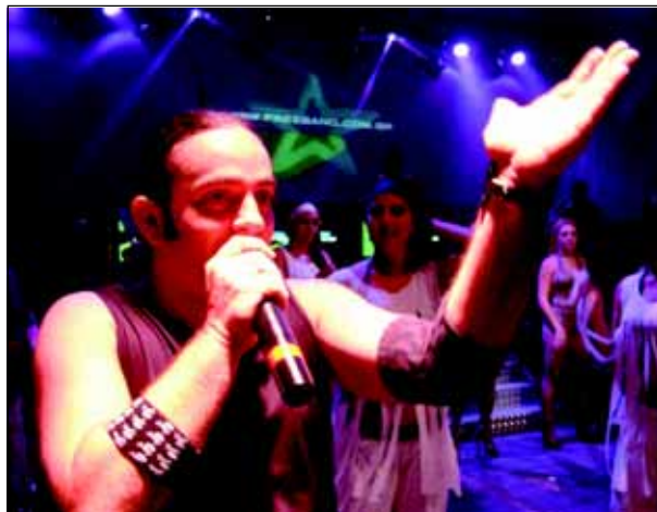
Vocalista e bailarinas da Free Band