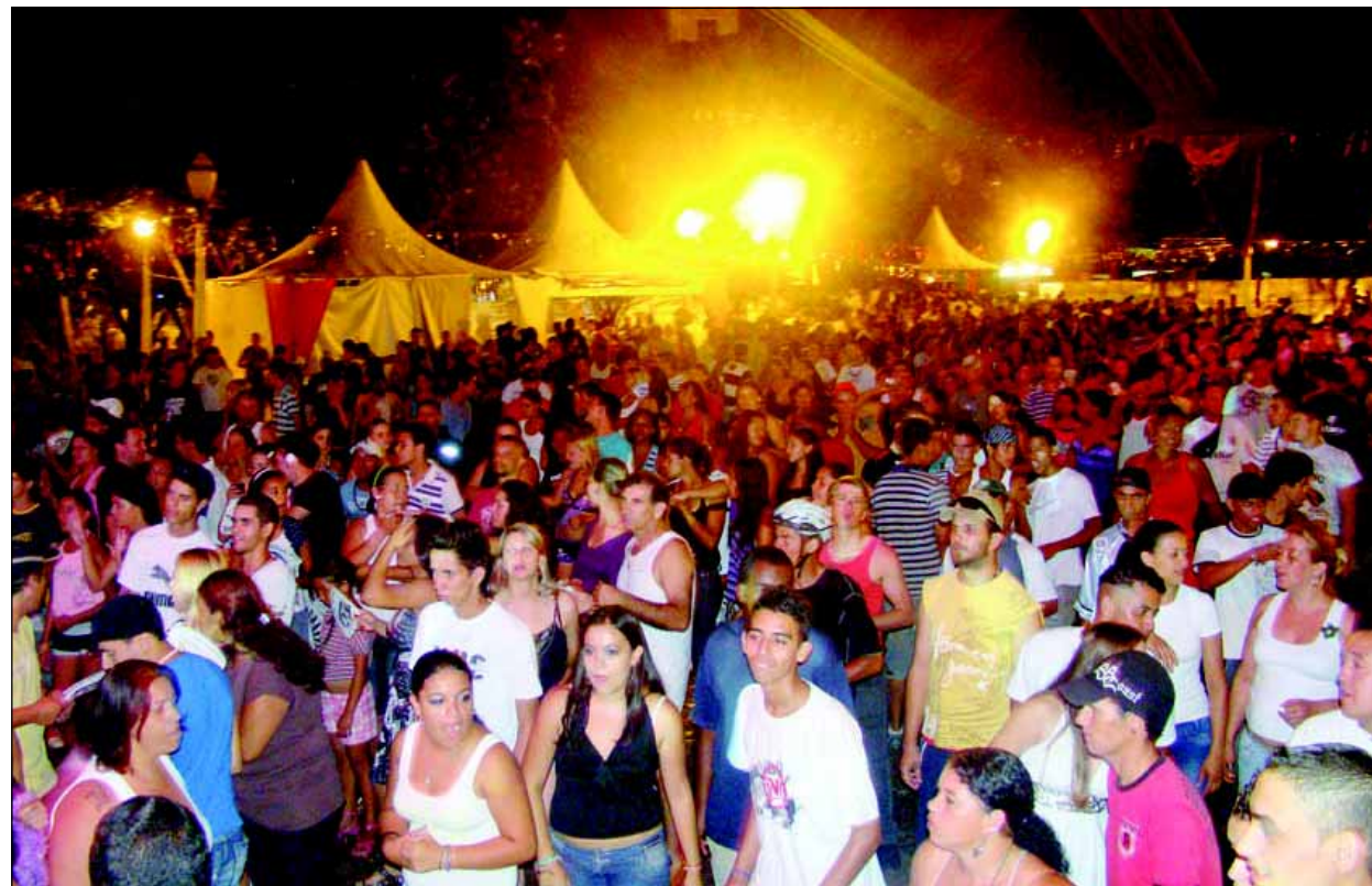
Grande público prestigiou o carnaval na Concha Acústica

Ainda no Largo São João, espaços exclusivos foram disponibiliza-