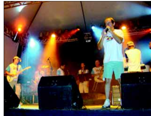
A Banda Fama agitou o carnaval no Largo São João