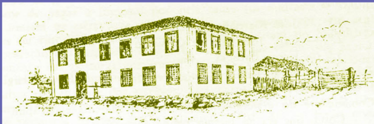
Cadeia Velha, 1885

A extensão do Municipio é de 55 kilometros de