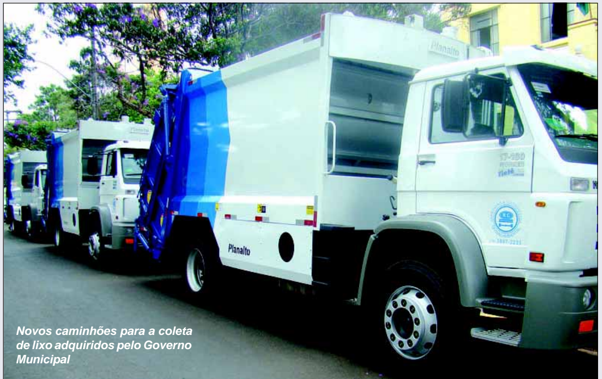
Novos caminhões para a coleta de lixo adquiridos pelo Governo Municipal

O Governo Municipal acaba de adquirir três caminhões, conquistados mediante contrato de locação, pedido feito já no ano passado pela Secretaria Municipal do Meio Ambiente. Os caminhões atenderão a coleta de lixo da cidade, proporcionando maior eficiência na limpeza pública.