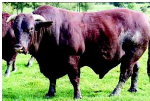
Os três primeiros eventos que contarão com a participação da raça Santa Gertrudis já estão definidos.