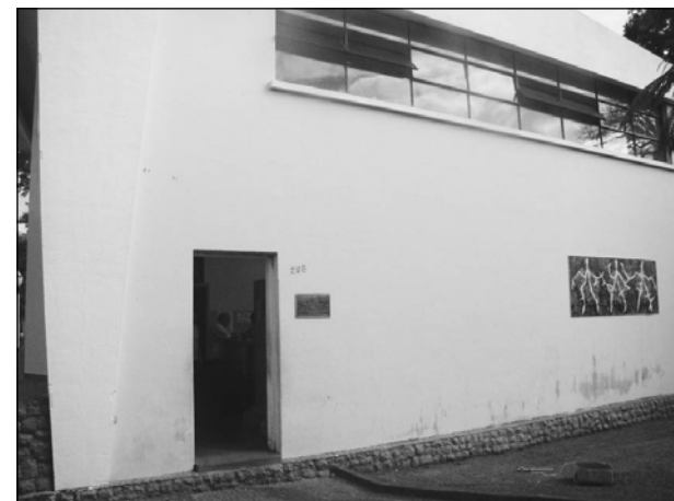
A sede da SEME está situada na Concha Acústica, no centro da cidade

Começou no último sábado a primeira Copa Avaré de Futebol sub-18, que já é considerada um dos campeonatos mais importantes do município. O objetivo é dar oportunidade aos jovens para que eles pratiquem futebol, além disso, a SEME quer revelar e renovar o esporte avaréense e regional.