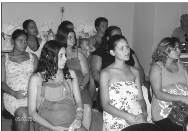
Palestra foi ministrada para gestantes