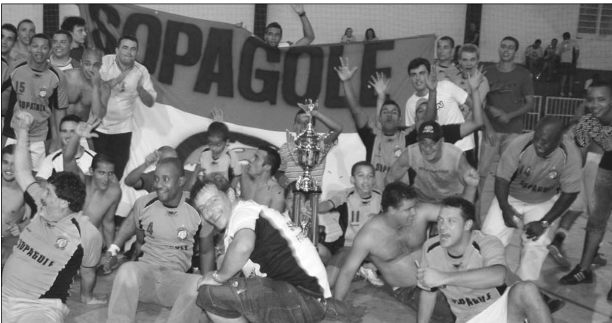
O Sopagole foi o time que levou menos gols na categoria Adulto: 14 apenas

O time do Supermercado Pinheirão/SMC/FJP/Sopagole e da Auto Elétrica do Jaiminho foram os grandes campeões da Copa Verão de Futsal realizada, de janeiro a fevereiro, pela Secretaria de Esportes na quadra poliesportiva do clube Centro Avaréense. As finais das duas categorias, Adulto e Veterano, ocorreram no dia 5 de fevereiro.