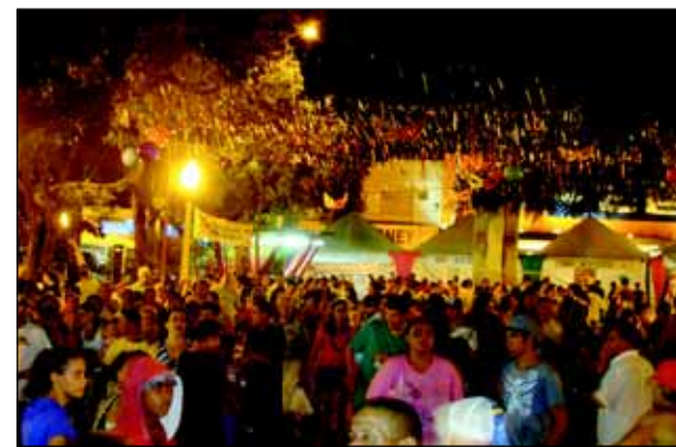
Carnaval de marchinhas animou os foliões no Largo São João

Já pensando no Carnaval 2.011, o Governo Municipal pretende manter a mesma estrutura deste ano, ou seja, Carnaval de Marchinhas no Largo São João e Micareta na Concha Acústica, mas com algumas inovações. Estuda-se a possibilidade de realização de um concurso de marchinhas para movimentar os músicos compositores de Avaré e região e quem sabe até mesmo de outros Estados.