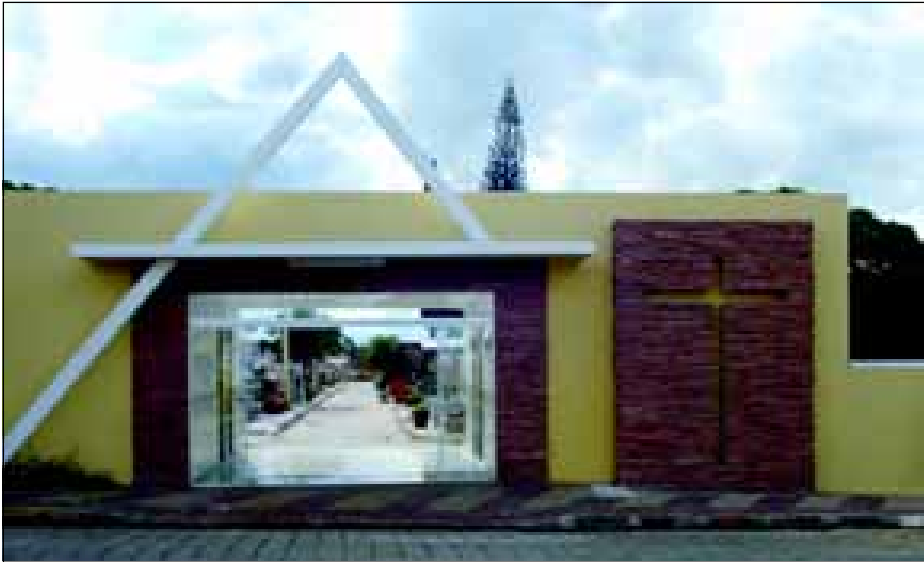
Reconstrução do acesso principal da Necrópole Municipal

A Prefeitura da Estância Turística de Avaré estará inaugurando nesta segunda-feira, obras de grande interesse da população, voltadas ao Bem Estar Social, Esportes e Lazer.