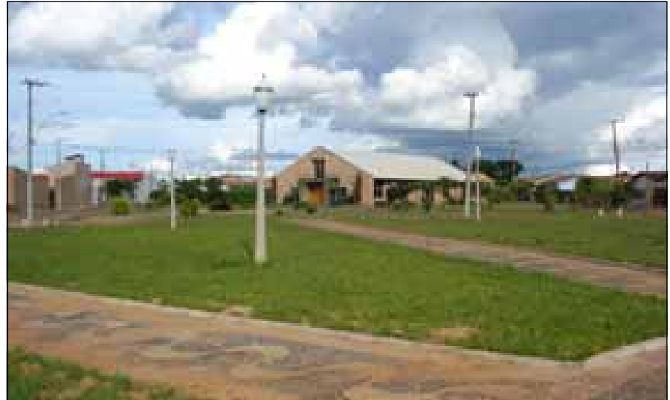
Urbanização da Praça Bom Jardim no bairro Jardim Paineiras

Com isso a Prefeitura confirma através dessa inauguração a finalização dos objetivos propostos entregando ao uso da população.