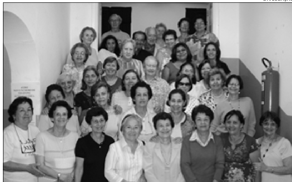
Alunos da turma de 2009