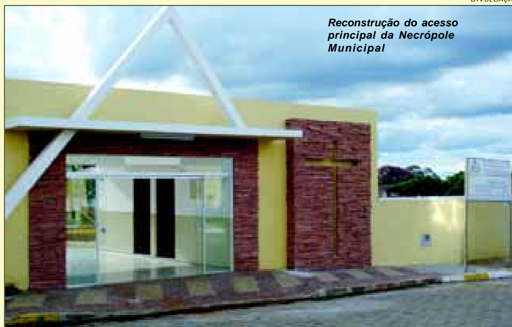
Reconstrução do acesso principal da Necrópole Municipal

O site oficial da Prefeitura de Avaré está sendo reformulado. Com a nova roupagem ele ficará mais dinâmico para que os cidadãos possam navegar com fácil acessibilidade. Página 20.