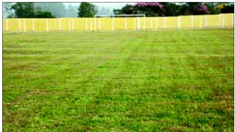
Entrega do novo campo de futebol denominado Centro Esportivo Engenheiro Nestor Puzziello no Jd. Paineiras