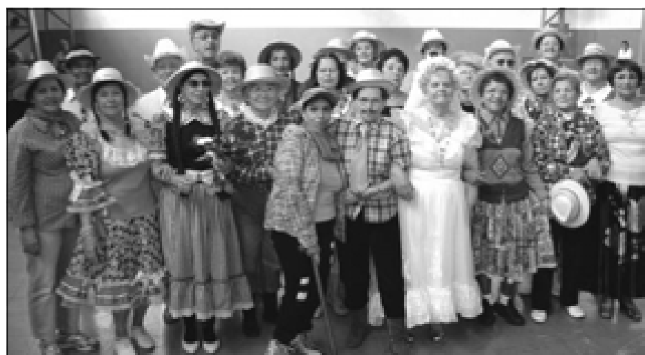
Alunos da FATI vestidos para Festa Junina

Ernandina - A FATI está aberta a todas as pessoas a partir dos 50 anos e que sejam alfabetizados. Casos especiais e por recomendação médica podem ser estudados e os candidatos a alunos, aceitos. Quem se interessar pode vir falar conosco que teremos muito prazer em apresentar a FATI.