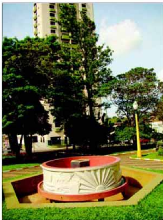
Monumento será restaurado com recursos do DADE

O indício mais antigo da divisão do dia é proveniente de um relógio de sol egípcio, datado de 1.500 antes de Cristo. O artefato corresponde a um método ou procedimento utilizado para medir a sucessão das horas ou do tempo por meio da visualização do modo como a luz solar incide na terra em diferentes posições e é justamente essa variação que fornece as horas.