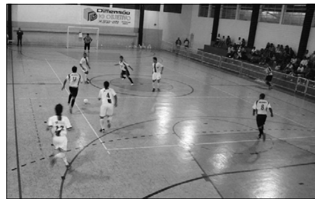
A primeira fase teve confrontos disputados de forma acirrada

Para a alegria da SEME e do Centro Avareense a Copa Verão de Futsal foi um sucesso de público, não faltando emoção aos espectadores.