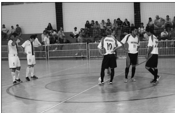
Todas as partidas foram realizadas à noite

categoria Adulto. Na categoria Veterano chegaram a final os times da Lotérica Arandu e da Auto Elétrica do Jaiminho; quem ficou com as vagas na decisão da categoria Adulto foram os times Supermercado Pinheirão/SMC/FJP/ So-pagole e Bar do Bola/Pão de Mel Conveniência. Os placares das partidas semifinais ficaram assim: Veterano – Lotérica Arandu 6 x 5 Turma da Ginástica e Auto Elétrica do Jaiminho 7 x 4 Fênix Alarme/Chico; Adulto – Supermercado Pinheirão/SMC/FJP/So-pagole 10 x 3 Deixaketos A e Bar do Bola/Pão de Mel Conveniência 4 x