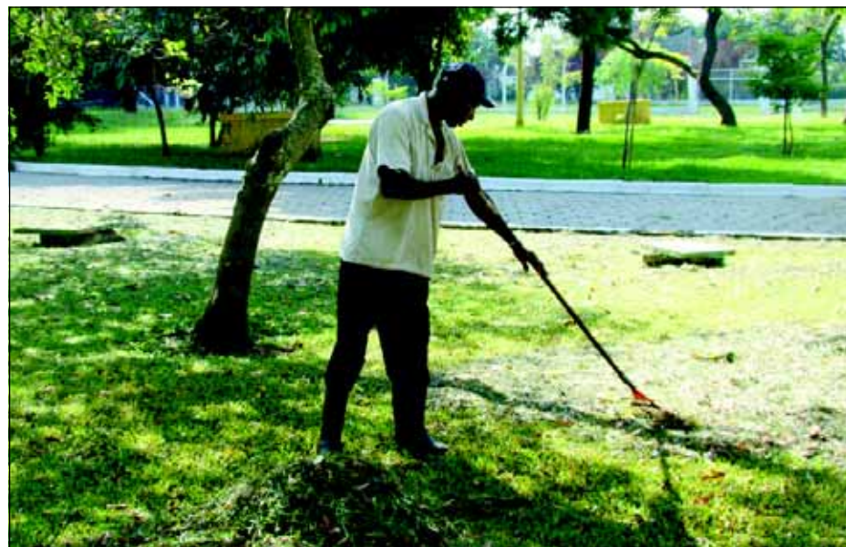
Funcionário prepara o local para receber foliões

Com uma estrutura inédita, com monitores de disciplina, decoração temática, praça de alimentação e entrada franca, além do Camping e do Balneário Costa Azul, na cidade a animação será no Largo São João,