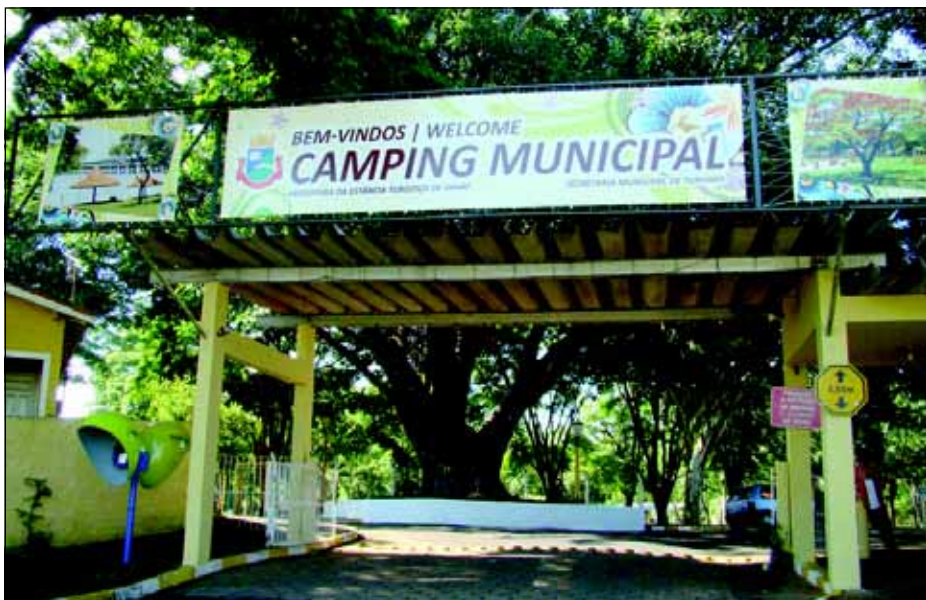
Entrada do Camping Municipal

O Camping Municipal “Dr. Paulo Araújo Novaes” e o Balneário Costa Azul vem sendo preparado para receber os turistas e foliões avareenses durante os festejos carnavalescos, que acontecerão nos dias 13, 14, 15 e 16, das 10h00 às 18h00, onde no local será montada uma tenda eletrônica, com DJ's que agitarão o local.