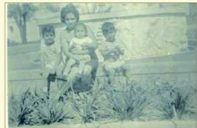
Mãe e filhos junto do monumento, 1970

Com recursos do Governo Estadual, através do Departamento de Apoio ao Desenvolvimento das Es-