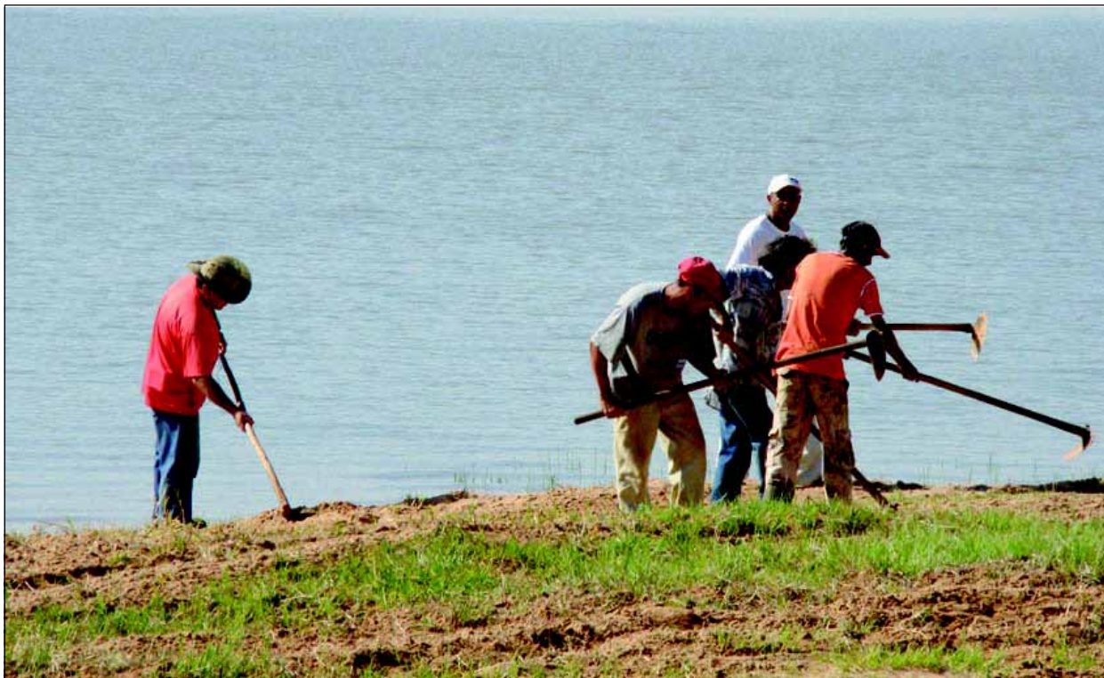
Funcionários preparam o camping para o carnaval