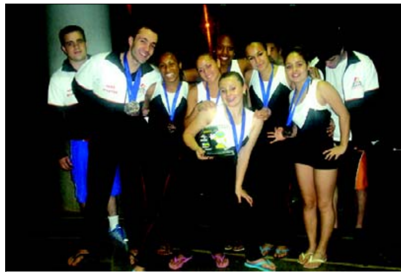
Ginástica Artística ganhou 20 medalhas

o time comandado por Odair Ferrazini conseguiu uma de ouro e duas de bronze. Ainda no individual Avaré conseguiu uma medalha de prata no karate.