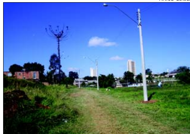
Prefeitura está executando o serviço

A Avenida Nações Unidas, no Loteamento Colina Verde, está recebendo iluminação pública. Apesar do loteamento existir desde 1975, tal benfeitoria ainda não havia chegado neste trecho.