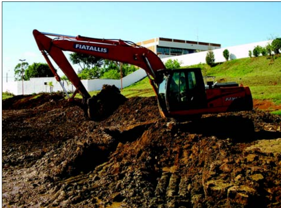
Maquinas estão trabalhando para a retirada do excesso de areia

A Prefeitura está iniciando um trabalho de desassoreamento e para isso máquinas estão atuando no local para a retirada do excesso de areia.