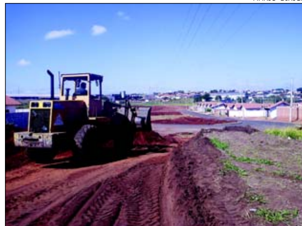
Avenida será um prolongamento da Avenida Itália

A Avenida Domingos Leon Cruz, no Jardim Santa Mônica, está sendo aberta pela Prefeitura da Estância Turística de Avaré. A Avenida interligará o trecho do Santa Mônica II ao Santa Mônica II e IV.