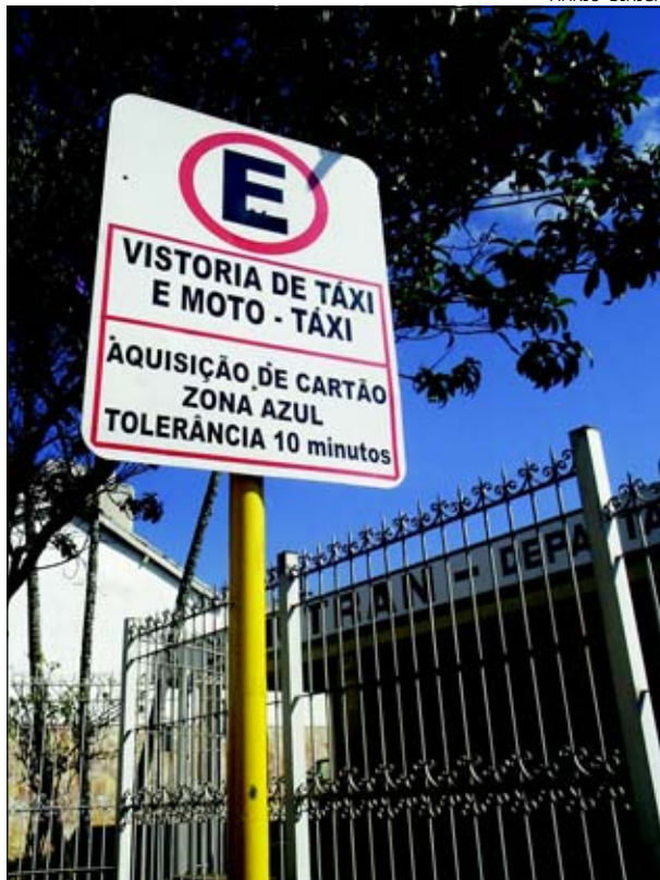
A medida visa dar mais comodidade ao motorista

De frente a sede do Departamento Municipal de Trânsito, na Rua São Paulo, 1559, no centro da cidade, o motorista poderá estacionar seu veículo, por um período de 10 minutos, para que possa adquirir cartões da Zona Azul. A medida visa dar mais comodidade ao motorista.