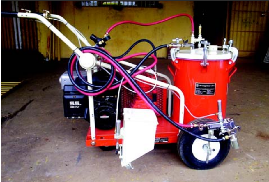
Equipamento gerará economia e agilidade

A Secretaria Municipal dos Transportes e Sistema Viário passa a contar com um novo equipamento que auxiliará na sinalização viária. Trata-se de uma máqui-