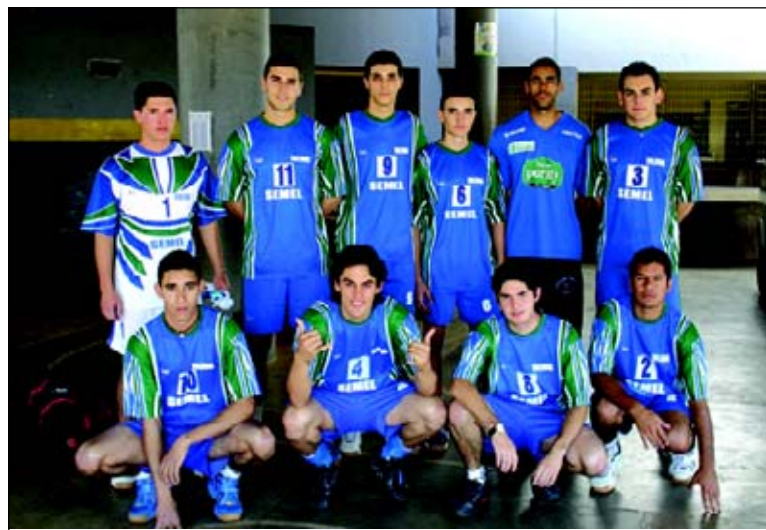
Handebol Masculino ficou em segundo lugar