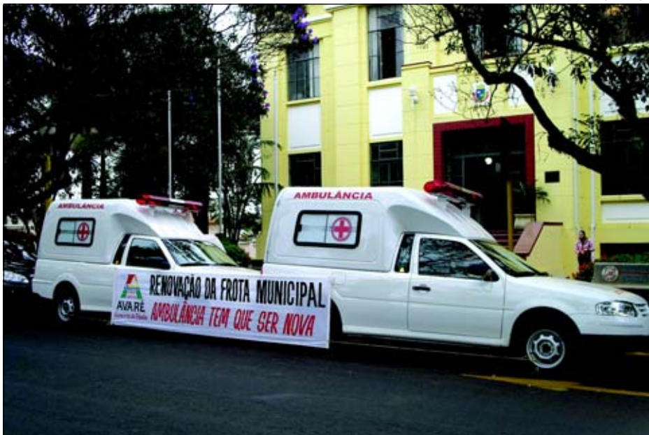
Veículos estão a disposição da Saúde

Adquiridas pela Prefeitura da Estância Turística de Avaré, duas novas ambulâncias passam a incrementar a frota municipal. Trata-se de