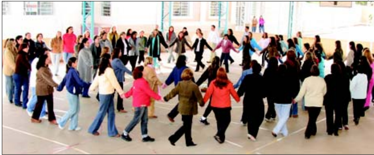
SECRETARIA DE EDUCAÇÃO

Curso foi ministrado para professores da Educação Infantil, Artes e Educação Física da Rede Municipal