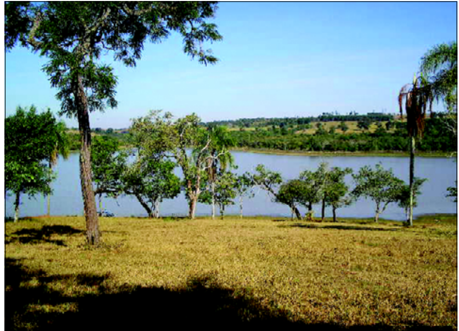
Área onde será construída a Colônia de Férias

diretores da entidade, a escolha por Avaré se deu pelo fato da cida-