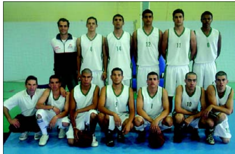
Basquete Masculino ganhou medalha de prata