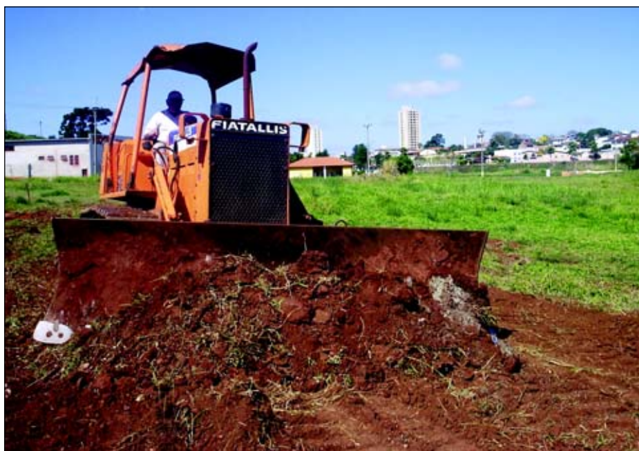
O trecho que está recebendo melhorias, compreende da Avenida Presidente Kennedy, até a Rua Fernando de Moraes

Além destas melhorias, a Prefeitura já encerrou o processo de licitação para a pavimentação das demais ruas