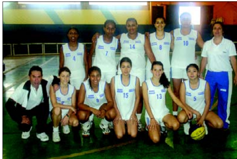
Basquete Feminino ficou com a medalha de bronze

No tênis de mesa há alguns anos Avaré não conseguia medalhas. Em Itapetininga,