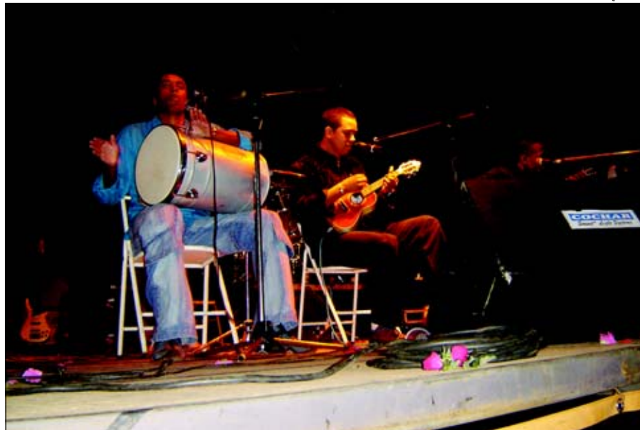
Evento acontece no Ginásio Kim Negrão de 14 a 17 de setembro

Os ingressos começarão a ser vendidos a partir do dia 4 de setembro em pontos de venda como APredileta, Wizard, CEMA e Secretaria de Cultura. Para a eliminatória avareense, no dia 14 de setembro, a entrada é franca. Nos demais dias o ingresso custará R$ 10,00 por noite.