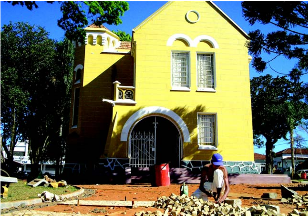
A nova calçada será em mosaico português

Com a verba do DADE (verba destinada a investimentos em turismo) a Prefeitura da Estância Turística de Avaré está executando a obra de reformulação da Praça Rui Barbosa. No local está o prédio onde funcionava o Antigo Fórum e hoje funciona a atual Secretaria Municipal de Cultura.