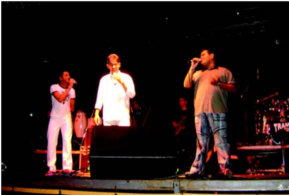
Músicos avareenses se apresentam no dia 14

Os músicos de todo país ainda podem se inscrever para participarem da 24ª Fampop (Feira Avareense de Música Popular). As inscrições vão até o dia 31 de agosto e podem ser feitas através do site www.festivaisdobrasil.com.br . Nesta fase não podem se inscrever músicos de Avaré, pois a fase avareense do festival já foi realizada.