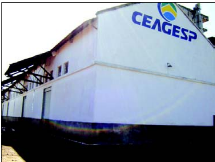
Feira será mais uma opção para o produtor e para o consumidor

A Secretaria da Agricultura e Abastecimento da Estância Turística de Avaré, em parceria com o SEBRAE e Associação