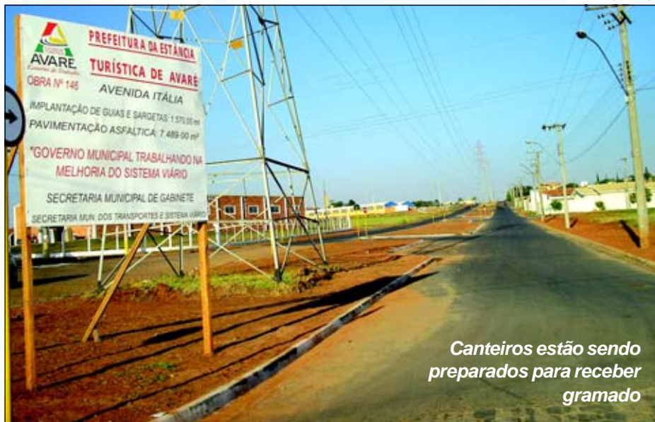
Canteiros estão sendo preparados para receber grama