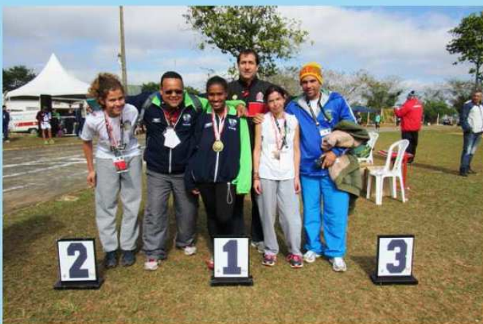
Atletas do atletismo ACD, masculino e feminino