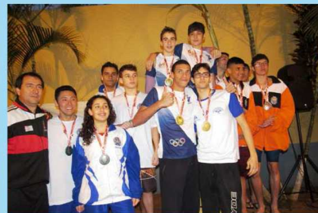
Atletismo ACD feminino, natação feminina e masculina conquistaram a medalha de ouro