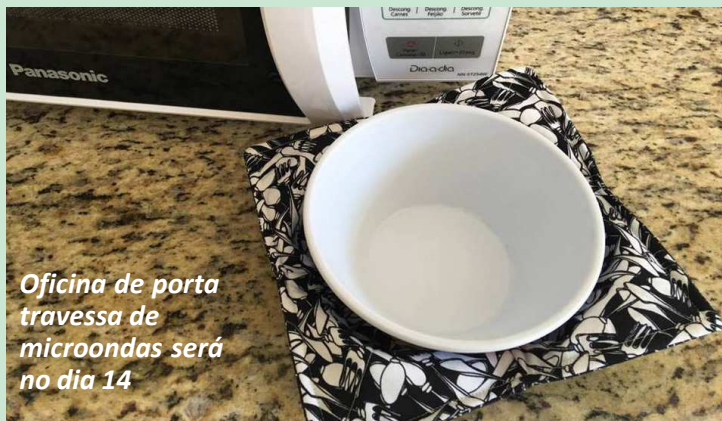
Oficina de porta travessa de microondas será no dia 14

Pelo segundo ano consecutivo, a Prefeitura vai apoiar a promoção da Feira Artesanal de Avaré, que terá lugar no Parque Fernando Cruz