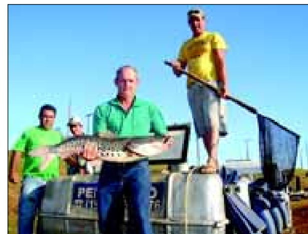
Diversas espécies de peixes foram soltos no lago