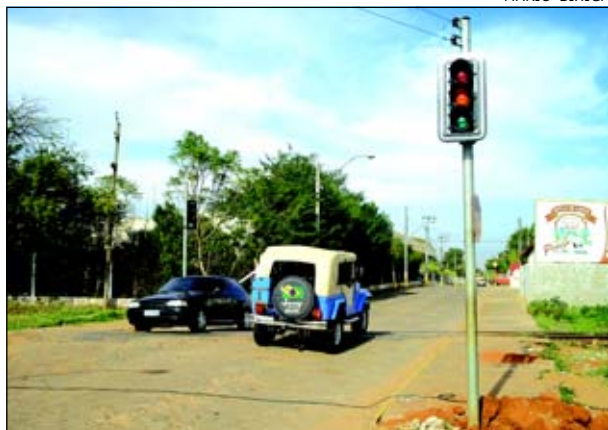
Medida visa dar mais segurança aos motoristas