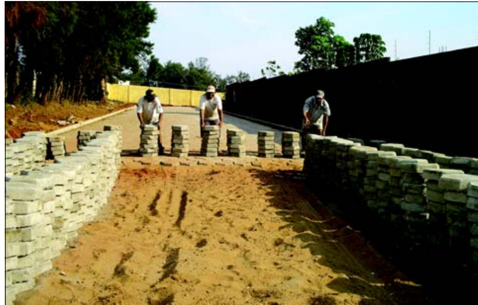
Prefeitura está realizando a obra de pavimentação

A via de acesso está recebendo pavimentação em lajota e vai desde a Avenida Paulo Novaes, até a Rua Mato Grosso.