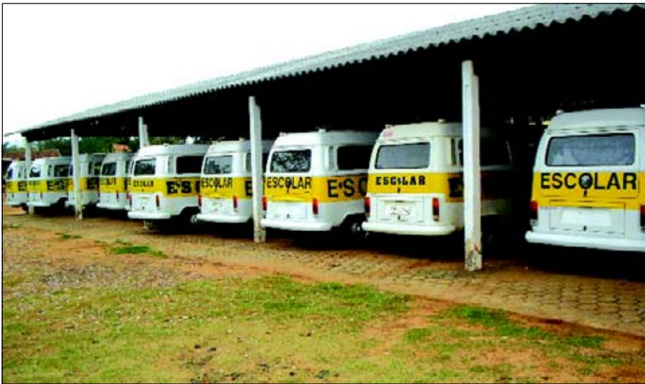
Prefeitura mostra preocupação com a conservação da frota municipal

Para que os veículos da frota municipal estejam sempre em ótimas condições para servir a população, a Prefeitura da Estância Turística de Avaré está trabalhando para manter toda frota em ordem.