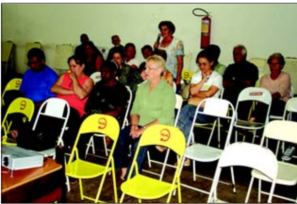
Reunião para os moradores da Região Central