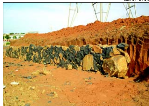
A avenida será o prolongamento da Avenida Itália através da Rodovia SP 255

A avenida será o prolongamento da Avenida Itá-