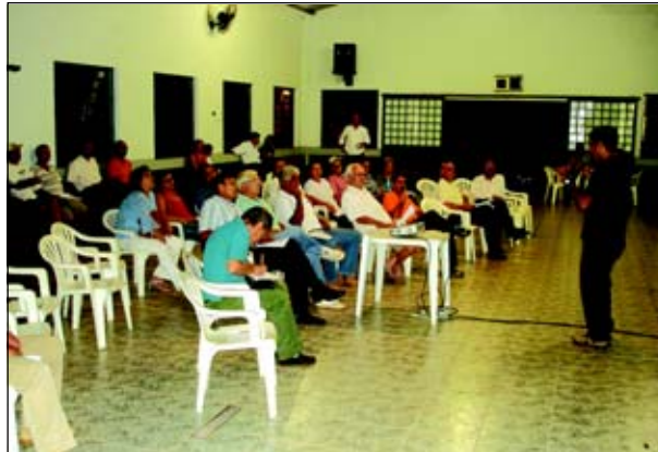
Reunião para os moradores dos bairros às margens da Represa

A Comissão para elaboração do Plano Diretor de Avaré, percorreu os bairros para ouvir as reivindicações da população. Essas reivindicações foram enviadas para os Grupos de Trabalho que estão analisando e poderão incluí-la no projeto final do Plano Diretor.