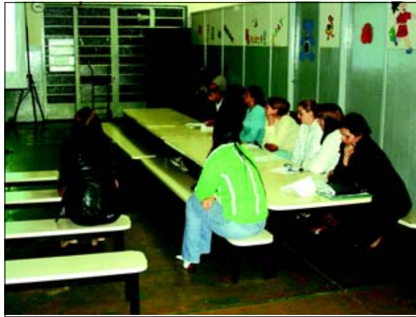
Reunião para os moradores da Região Leste