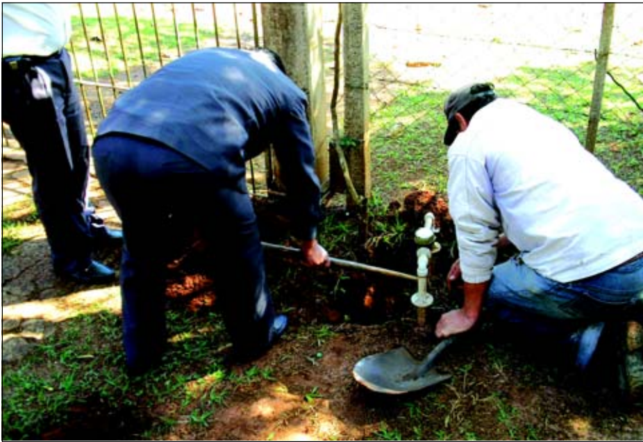
Fiscais trabalham para evitar ligações clandestinas

Os fiscais da Prefeitura da Estância Turística de Avaré realizaram vistoria nas ligações de água no Loteamento Ponta dos Cambarás, situado às margens da Represa de Jurumirim.