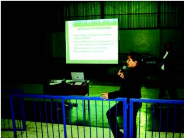
Reunião para os moradores da Região Sul