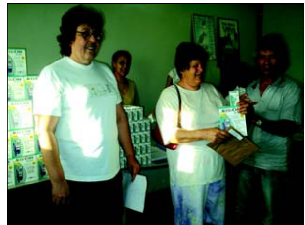
Pacientes já estão recebendo os aparelhos

Nesta semana a Prefeitura da Estância Turística de Avaré, através da Secretaria Municipal de Saúde, começa a distribuição de aparelhos para a medição de glicemia. Os aparelhos adquiridos pela Prefeitura serão cedidos aos pacientes com diabetes cadastrados no Centro de Saúde. Esses aparelhos serão cedidos, sendo que o paciente deverá utilizá-lo com critério, não podendo emprestá-lo e nem cede-lo para outro paciente. "O uso deste aparelho é individual e deve ser utilizado