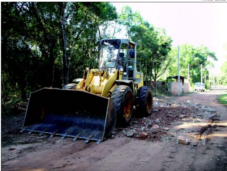
Ruas do Costa Azul recebem cuidados por parte da Prefeitura

Apesar do período de estiagem, a Prefeitura da Estância Turística de Avaré mantém o trabalho de manutenção das vias públicas do