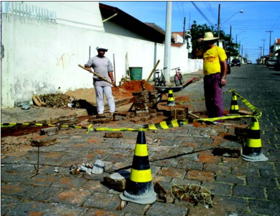
Ruas que estejam em más condições são consertadas

A Prefeitura da Estância Turística de Avaré continua com a operação “cata-buraco”. Uma equipe percorre trechos da cidade e concerta todas as irregularidades nas ruas, como buracos, desnível, rejuntas, entre outros.