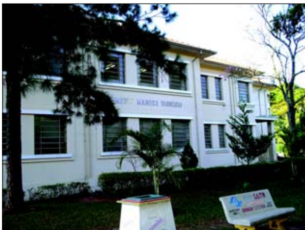
Escola Maneco Dionísio