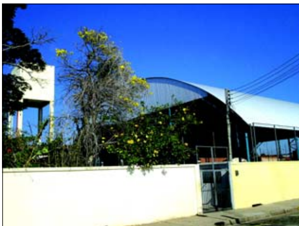
Escola Salim Antonio Curiati

No domingo (dia 30/07) será realizado o concurso público da Prefeitura da Estância Turística de Avaré para preenchimento de cargos efetivos. São 87 vagas em 27 cargos diferentes. As inscrições encerraram-se no dia 10 de julho e totalizou 3.319 inscritos.