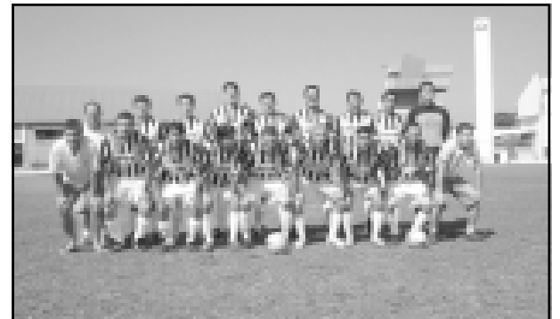
Amigos da Sauna

Pela Primeira Divisão, no Campo Municipal o Vila Novagoleou o Jurumirim por 8x0.