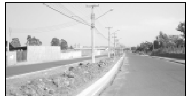
Colocação de guia e sarjeta na Avenida Donguinha Mercadante

denciou a reconstrução da Ponte Metálica sobre o Ribeirão Água da Onça. A reconstrução foi necessária pois houve o rompimento da base da ponte. Desta forma a ponte foi reconstruída em um outro local, mais seguro. A ponte dá acesso a Fazenda Mac Lee.