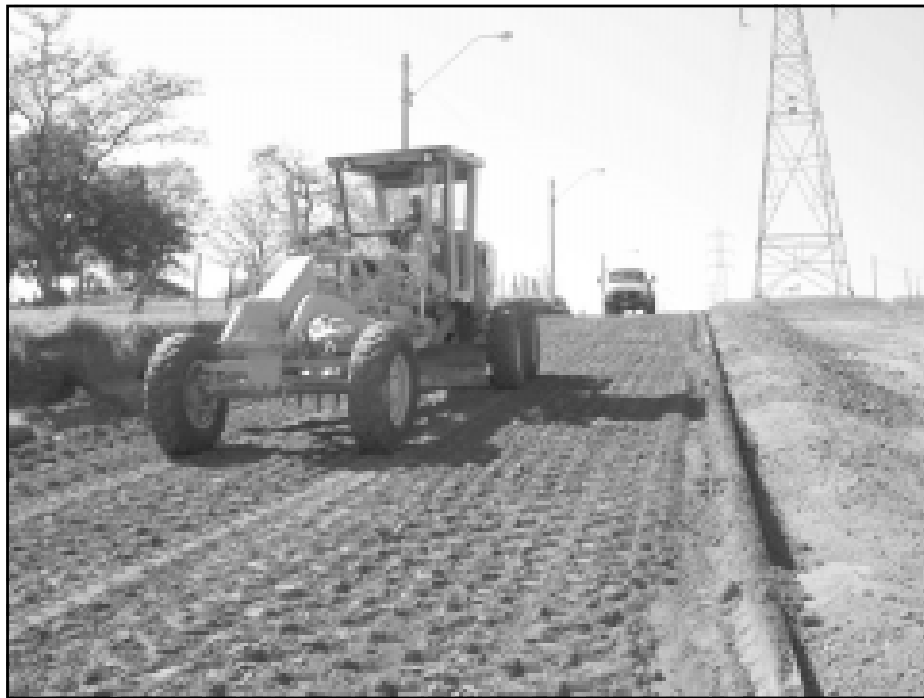
Pavimentação da Avenida Espanha

Está em processo de execução a pavimentação da segunda pista da Avenida Espanha em seu primeiro trecho, que vai da Rua Carmen Dias Farias até a Antonieta Paulucci. O segundo trecho já está em processo de licitação e em pouco tempo deverá ser