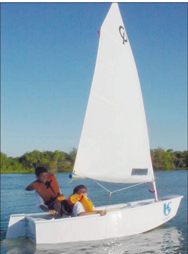
Competições de Vela foram realizadas durante o evento

Mais uma parceria de sucesso entre a Prefeitura e Governo do Estado, o I Festival Navega São Paulo, realizado no último domingo, 3, reuniu 525 atletas em Avaré (alunos do projeto), que participaram das competições de vela, remo e canoagem, nas águas da Represa de Jurumirim, supervisionado pelos instrutores e monitores (65 no total) do Projeto Navega SP, juntamente com as Federações Paulista de Vela, Remo e Canoagem, que garantiram a aplicação das regras oficiais nas disputas.