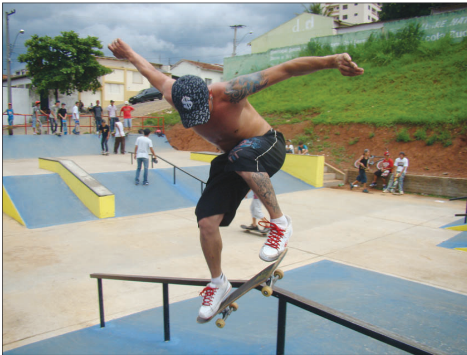
Pista de Skate “José Rodrigo Suman”

Será realizado um campeonato para os praticantes de skate nas categorias infantil, mirim e iniciante, que será julgado por atletas profissionais convidados, com premiação até o quinto lugar. Haverá ainda um professor ou atleta profissional mostrando ao público um pouco de cada modalidade esportiva, dando a