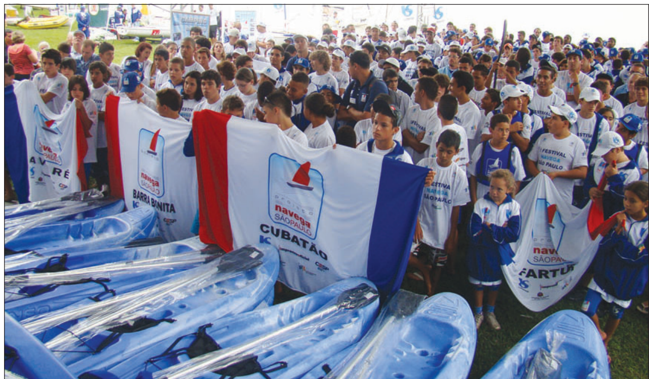
Mais de 15 núcleos do Projeto Navega SP participaram do Festival em Avaré

Na abertura, estavam presentes o velejador e medalhista olímpico em Montreal/1976 Peter Ficker, o atleta olímpico