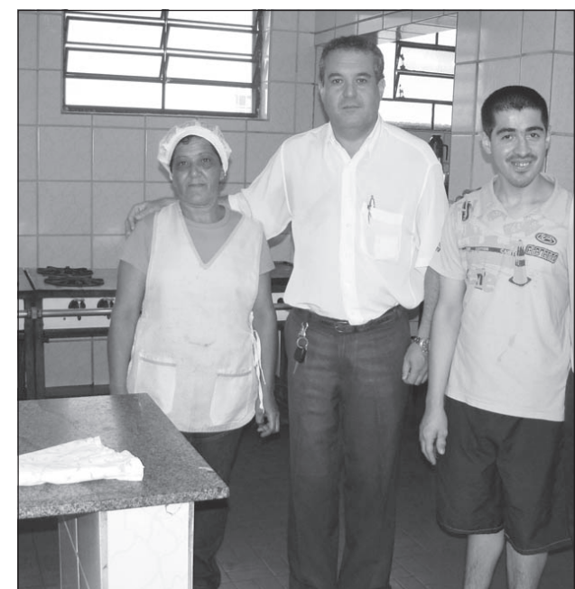
Instituição Padre Emílio Immoos será reformada

em atraso tais como, 13° salário, INSS, sa-