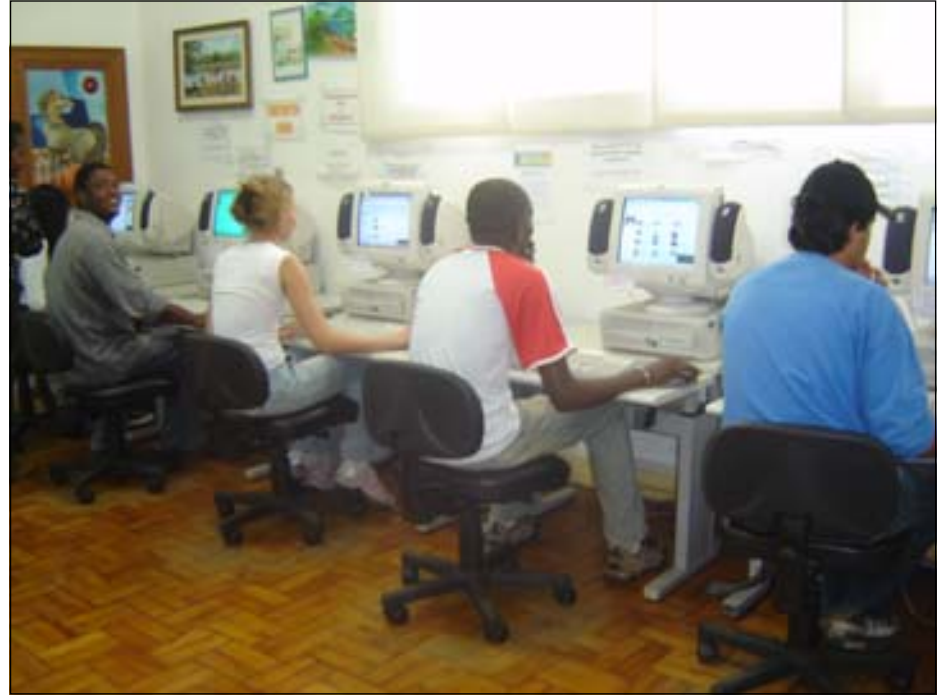
Usuários do Infocentro têm cinco computadores a disposição

Para utilizar o acesso, o usuário necessita fazer um cadastro, na qual será preciso levar uma foto e o RG para emissão de uma carteirinha. Para os usuários de 11 a 15 anos é necessário estar acompa-