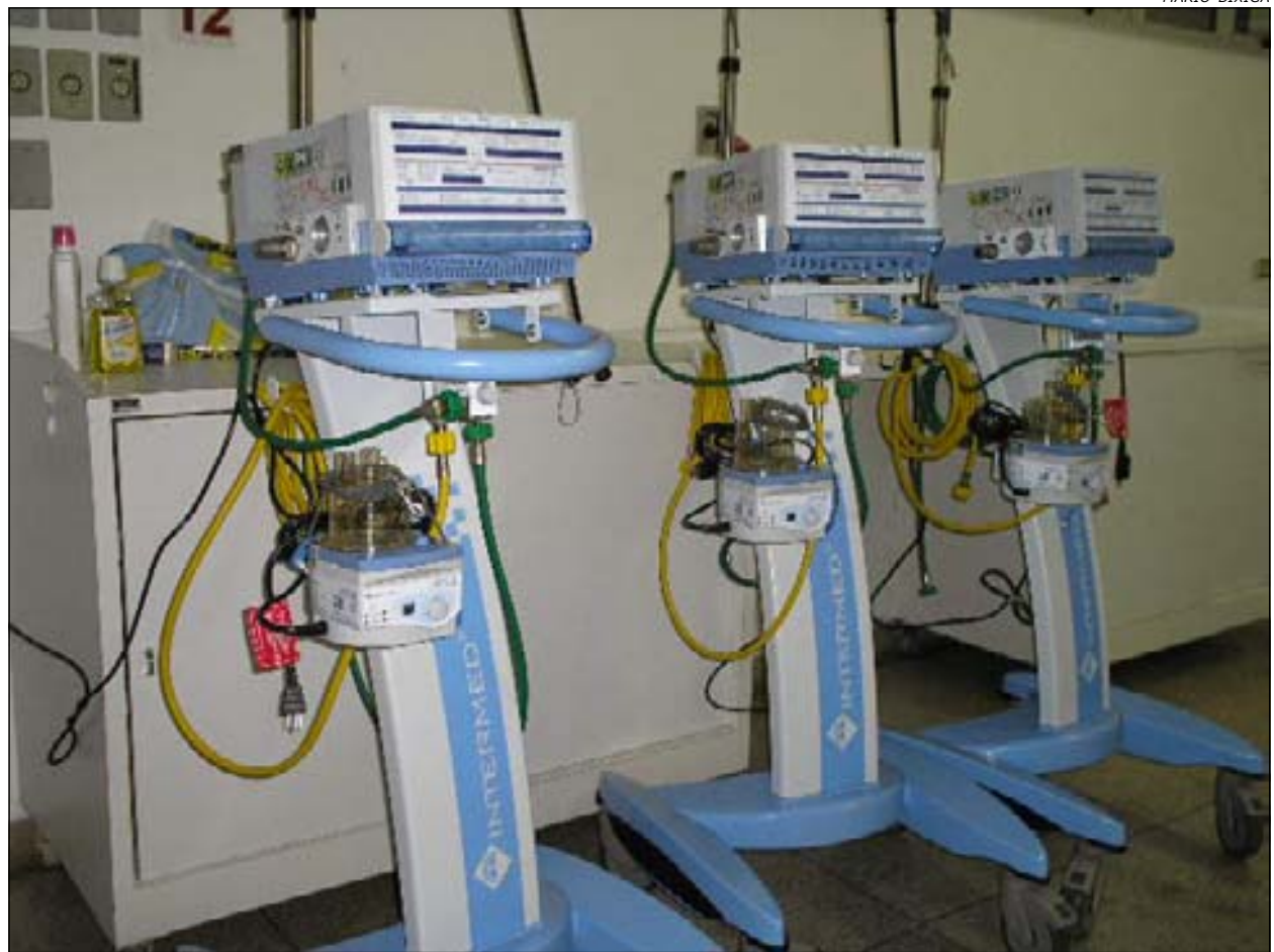
Equipamentos de última geração estão a disposição na UTI