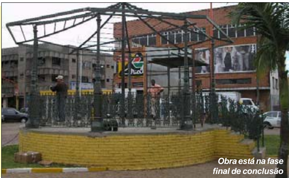
Obra está na fase final de conclusão