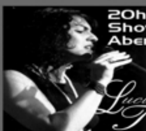
20h00 Show de Abertura