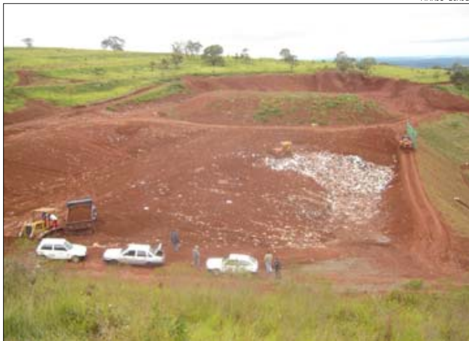
Aterro Sanitário já está em funcionamento

A Secretaria de Meio Ambiente resolveu informar as empresa depois de receber a informação de que algumas delas estariam depositando o lixo orgânico no antigo Lixão. Sendo assim a Secretaria do Meio Ambiente informa que o antigo Lixão está desativado e não pode mais receber resíduos sólidos.