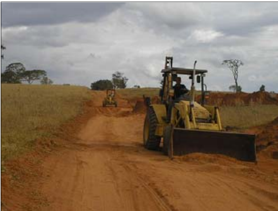
O trabalho está ocorrendo todos os dias, inclusive aos sábados e domingos