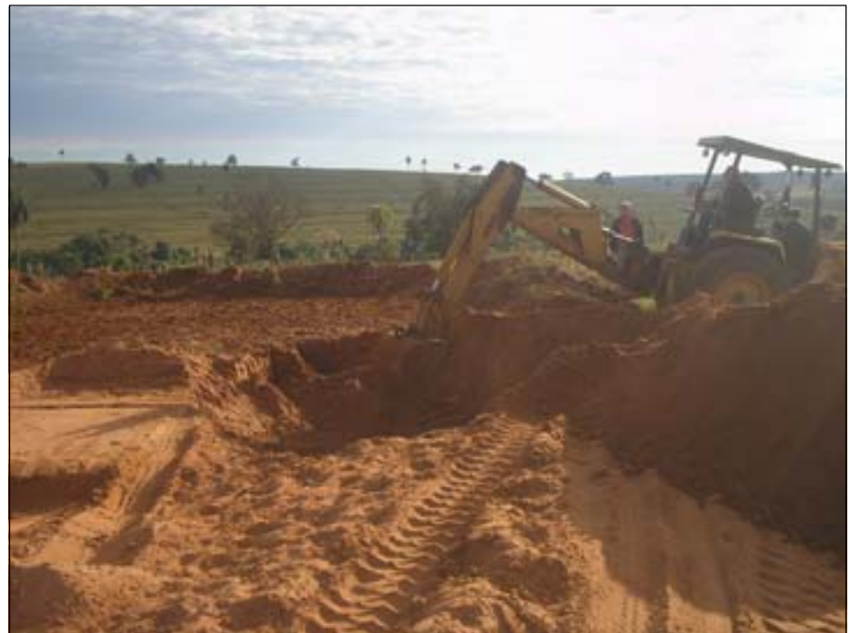
Caixas de captação de água em todas as estradas estão recebendo limpeza