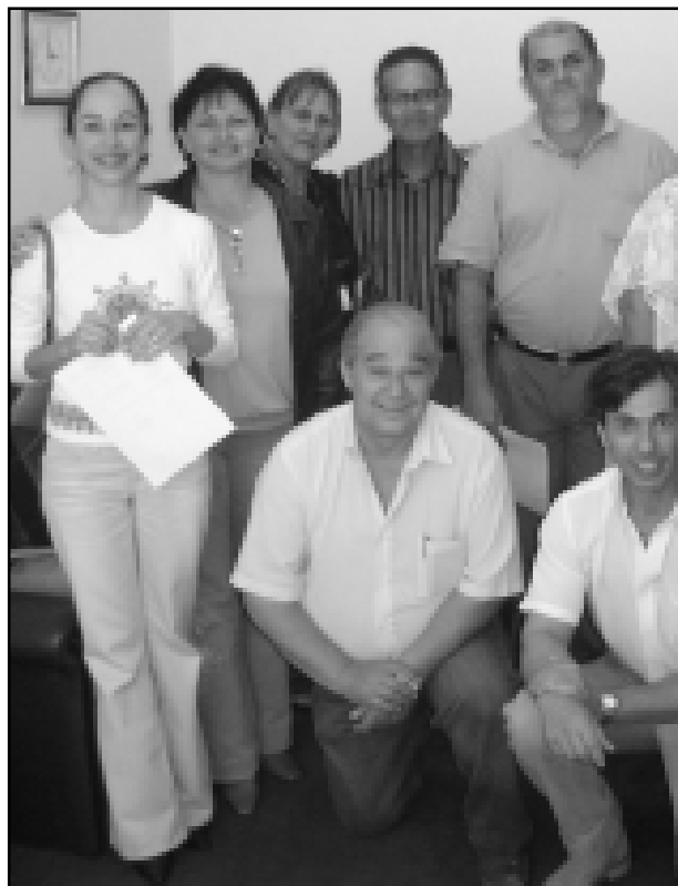
Representantes das entidades que assinaram o convênio.