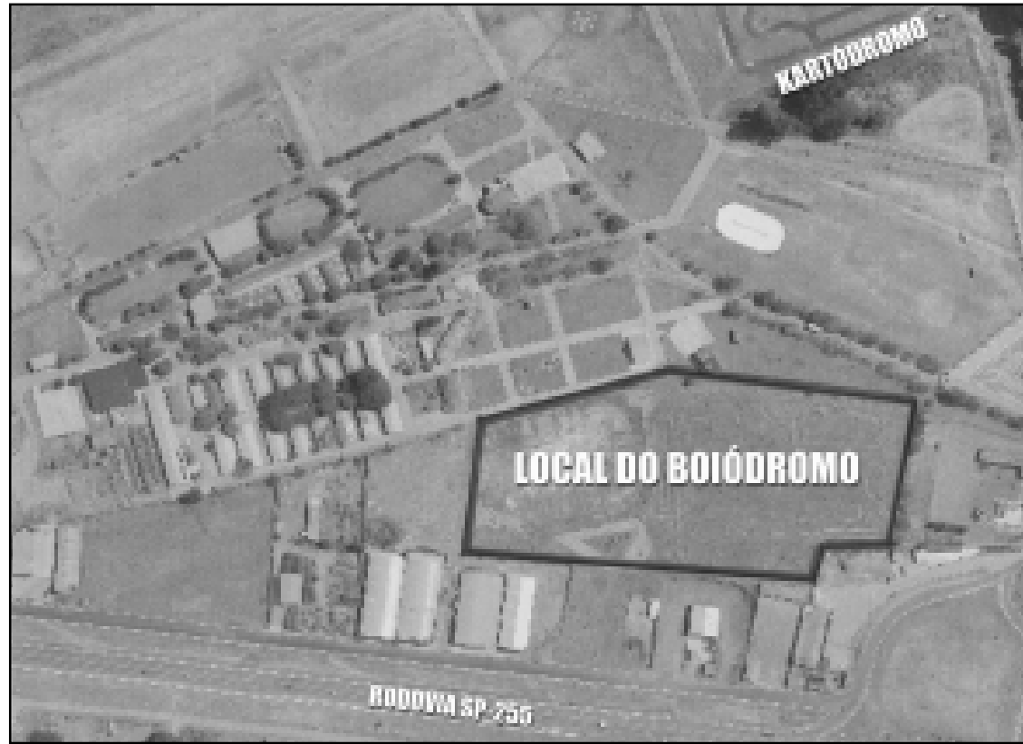
Local onde será construído o Boiódromo

No sábado a campanha será intensificada, com todos os postos de saúde atendendo além de outros