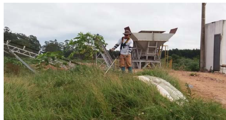
Limpeza na área do triturador de entulhos

uma questão de saúde e manutenção pública. Uma cidade que pretende receber turistas precisa estar bem cuidada. Esta é a nossa missão. A dificuldade é grande em razão da falta de equipamentos e verbas, aos poucos vamos superar isso e entregar uma Avaré diferente, mais bonita para a população”.