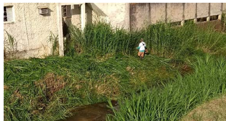
Limpeza na Avenida Major Rangel