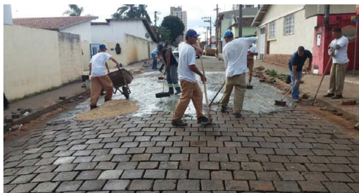
Rua Pará sendo finalizada

“A Rua Pará houve um atraso na entrega, por conta de alguns processos burocráticos, mas estamos com um cronograma extenso, buscando atender de forma organizada as demandas existentes. Sabemos que tem muito a ser feito. Por isso, pedimos não somente a colaboração da população em não jogar lixo em via pública, como também que