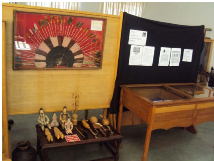
Peças que retratam a cultura indígena

ra caiuíá é mostrar aos avarenses, principalmente aos estudantes, as nossas próprias raízes, revelando como era o ambiente e os costumes do povo nativo que escreveu a