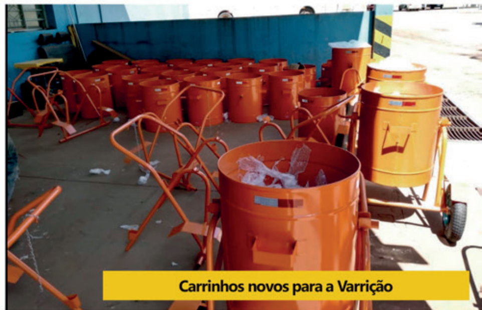
Carrinhos novos para a Varrição