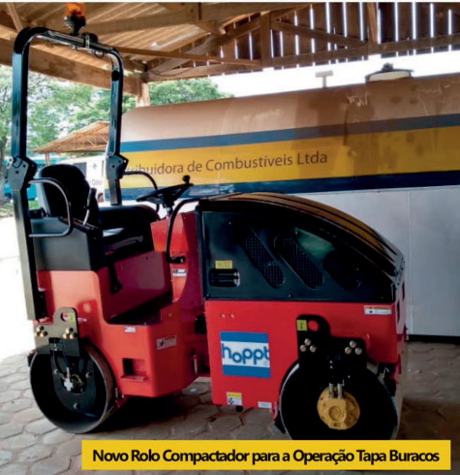
Novo Rolo Compactador para a Operação Tapa Buracos