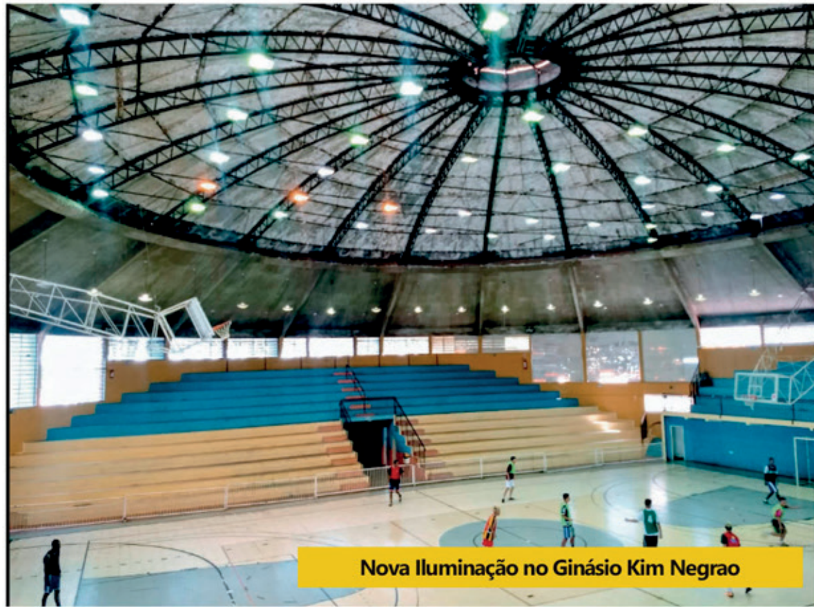
Nova Iluminação no Ginásio Kim Negro