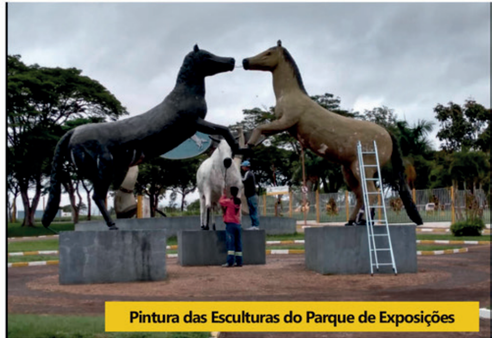
Pintura das Esculturas do Parque de Exposições