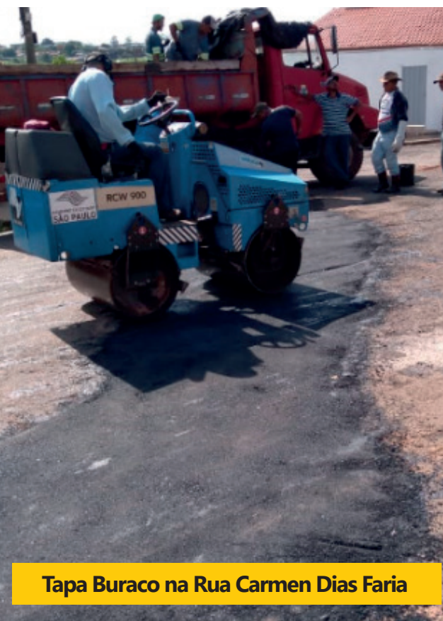
Tapa Buraco na Rua Carmen Dias Faria

No esporte, os ginásios Kim Negrão e Tico do Manolo receberam novos sistemas de iluminação. No Centro Cultural Elyther Pires Novaes, ventiladores foram instalados para maior