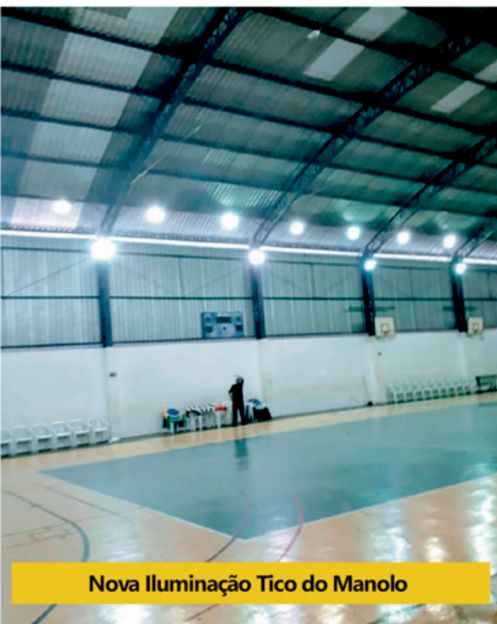
Nova Iluminação Tico do Manolo

Já no Parque Fernando Cruz Pimentel (recinto da Emapa) diversas intervenções estão ocorrendo, como nova pintura das esculturas existentes na Praça dos Criadores e obras de adequação foram feitas para deixar o espaço em ordem a fim de receber as atrações da 50ª edição da EMAPA, programada para o período de 1o a 9 de dezembro, com entrada franca.