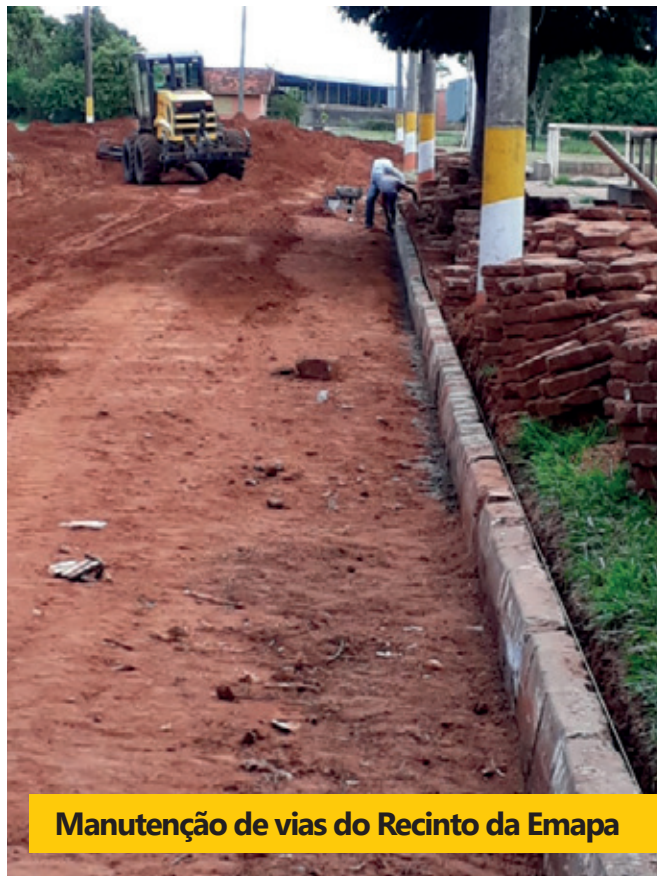
Manutenção de vias do Recinto da Emapa