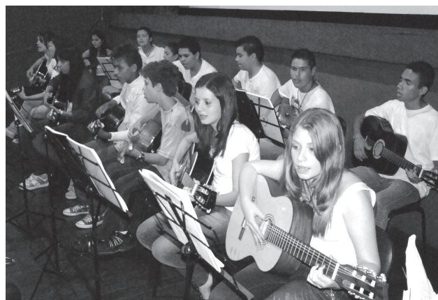
Oficinas oferece cursos de violão anualmente

Além disso, as Oficinas também deu origem ao Grupo Municipal de Teatro Popatapataio, ao Coral