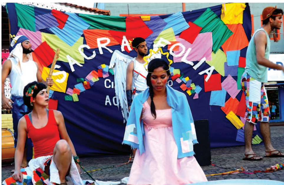
Sacra Folia abriu Festival Natalino

Encontro de Corais é uma das atrações do Festival, que se encerrou-se na noite de ontem