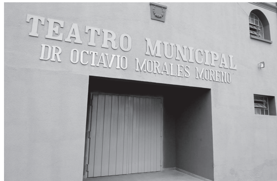
Obras do Teatro Municipal chegam a sua reta final

É o Governo Municipal demonstrando toda a sua dedicação e carinho com a Cultura avareense!!!