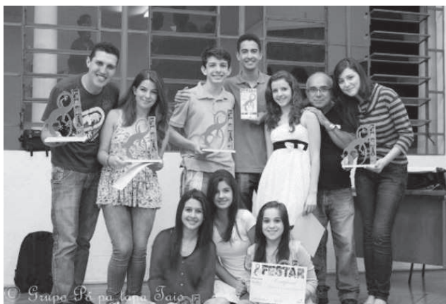
Grupo Municipal de Teatro teve origem com as Oficinas Culturais