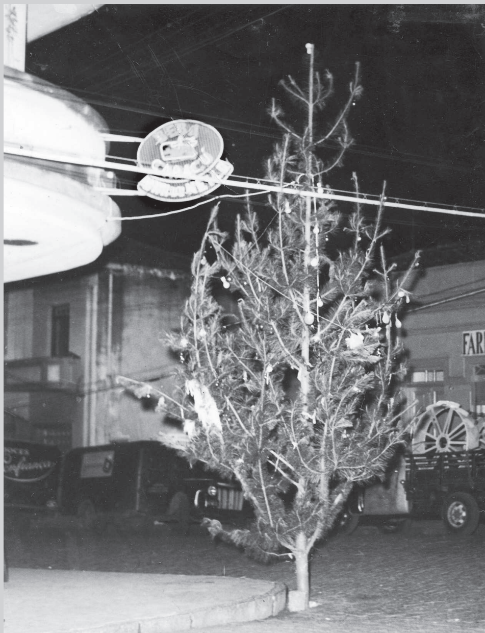
Árvore de Natal montada na esquina do Largo São João, 1955

Da procissão do Menino Jesus à primeira árvore montada na praça