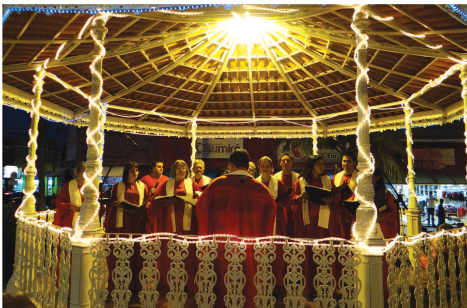
Coral da Igreja Presbiteriana apresentou seu lindo repertório natalino