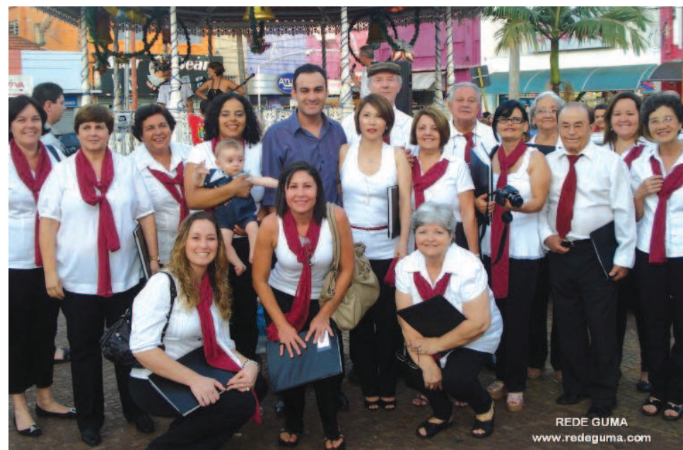
Coral Municipal encerrou Festival