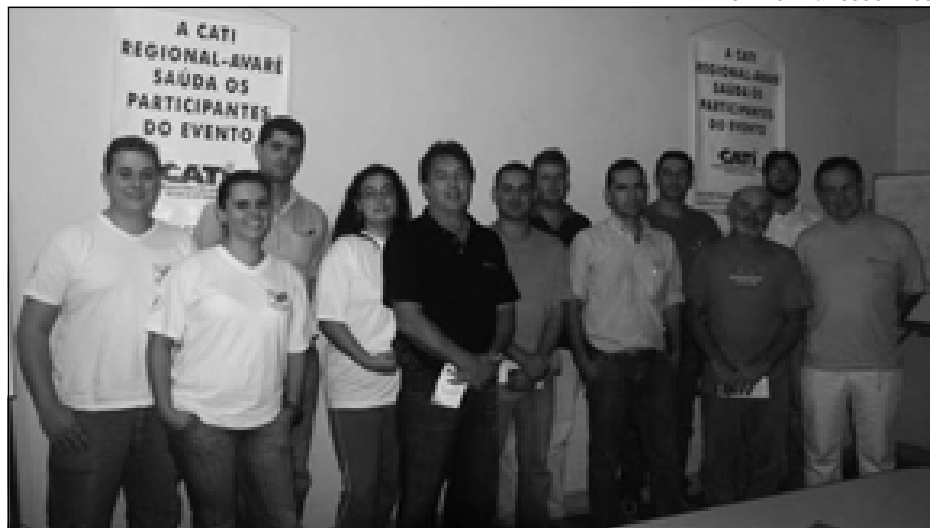
Núcleo Sudoeste Paulista: legalizado e pronto para fortalecer a cadeia produtiva de ovinos e caprinos na região

tuga, falou sobre a linha de produtos da empresa para ovinos e caprinos e abordou a criação do Comitê Gestor de Ovinos e Caprinos da Tortuga, que é uma equipe de técnicos especializados em alimentação e criação. Segundo ele, o comitê vai divulgar novas tecnologias, incentivar a cadeia produtiva, ofertando soluções eficientes e inovadoras e promovendo a integração entre produtores, frigoríficos, curtumes, restaurantes e técnicos.