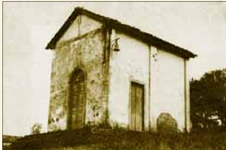
Antiga igreja da Boa Morte em foto dos anos 50

O "Correio do Sertão" conclui o interessante registro, feito há mais de cem anos, informando que na época ainda existiam "num bairro desta cidade, bem conservada a velha capelinha, em que es-