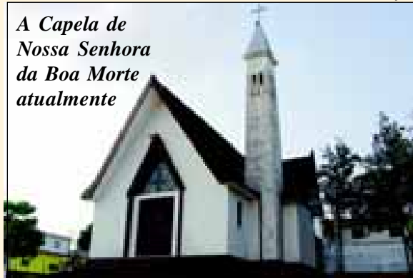
A Capela de Nossa Senhora da Boa Morte atualmente

Esta semana o cronista Gesiel Júnior esclarece na crônica “Igreja da Boa Morte guarda imagem doada pela imperatriz” que esse templo não pode ser confundido com a Capela do Major, lugar da fundação da cidade que está onde hoje é o