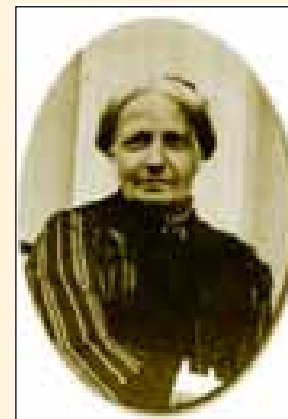
Imperatriz Teresa Cristina, doadora da imagem

tão os donativos imperiais. Os 300$000 foram aplicados na sua construção. Quanto à pedra d'ara e os castiçais não se sabe onde foram parar. Nada, porém, foi aplicado à Matriz desta cidade, cuja padroeira é Nossa Senhora das Dores. Nesta modesta capela existem imagens e objetos que se prendem à história e à vida de Dom Pedro II e de Dona Teresa Cristina e à história do Brasil".