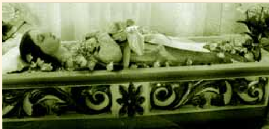
Estatueta de Nossa Senhora da Boa Morte

teiro (em Barreiro, atual Arandu). Devido, porém, a certos desgostos, mudou de plano quando o madeiramento já estava pronto, transferindo tudo para a Vila do Rio Novo, levantando-a no Bairro Alto, bem em frente à sua residência".