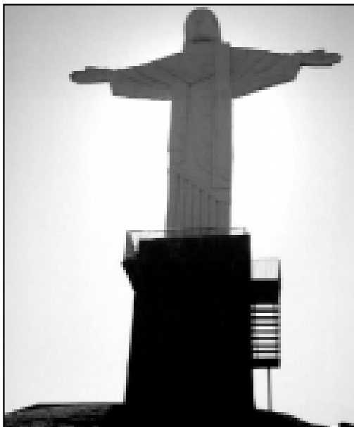
No Cristo Redentor, um dos principais pontos turísticos da cidade, a iluminação foi renovada