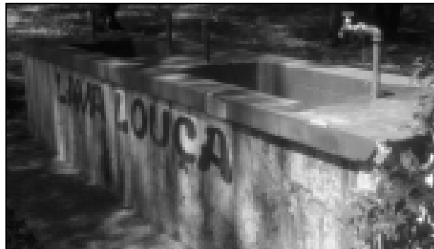
Reforma do Camping se faz necessária

Estima-se que a Miner Água Mineral Santa Bárbara deverá investir R$ 30 mil para reformular o Camping de Avaré.