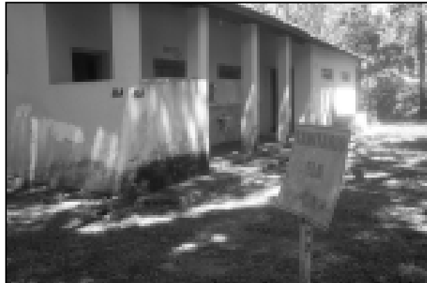
O Camping Municipal já está passando por reformas

“A terceirização foi o meio encontrado para que a cidade possa continuar a crescer, oferecer atrativos para os turistas e ao mesmo tempo economizar recursos”