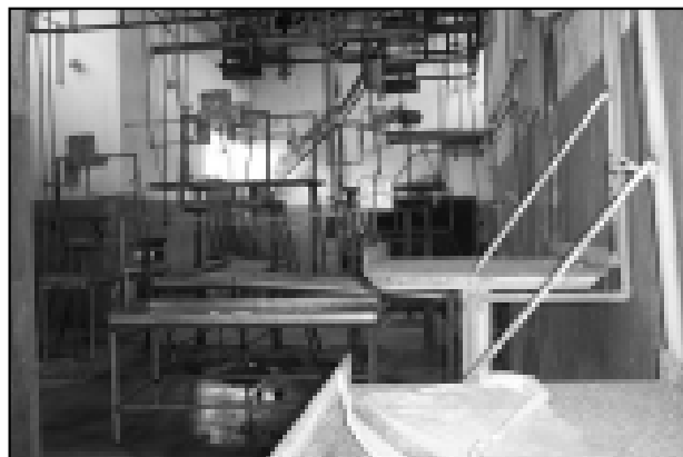
Terceirização é a única solução para o Matadouro

Camping deverão ser analisadas pelo departamento jurídico da Prefeitura e poderão ser colocadas em prática dentro de pouco tempo.