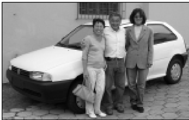
Gol 0km: Clube Socena