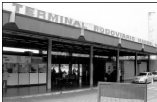
Terminal Rodoviário dá prejuízo de cerca de R$ 5 mil por mês