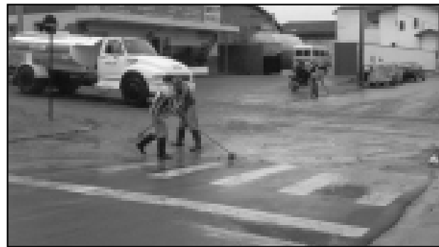
A Prefeitura está realizando intensos trabalhos para a recuperação dos estragos

Várias ruas tiveram o piso danificado, mas as equipes da Prefeitura estão trabalhando para normalizar a situação.