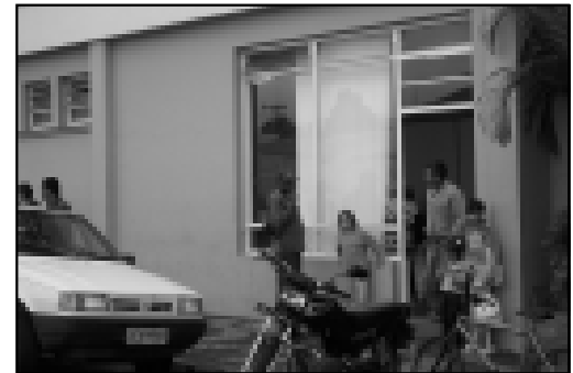
Fundo Social agora está atendendo no Centro Administrativo

A Secretaria do Bem Estar Social pretende dar continuidade