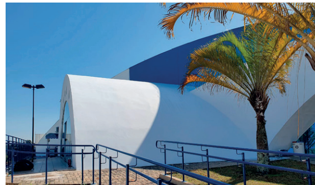
Área externa com pintura revitalizada

A pintura externa e interna do prédio para melhorar a estética e preservar a estrutura física das instalações do legislativo. As obras estão em pleno vapor.