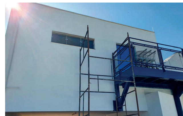
A reforma continua em toda estrutura