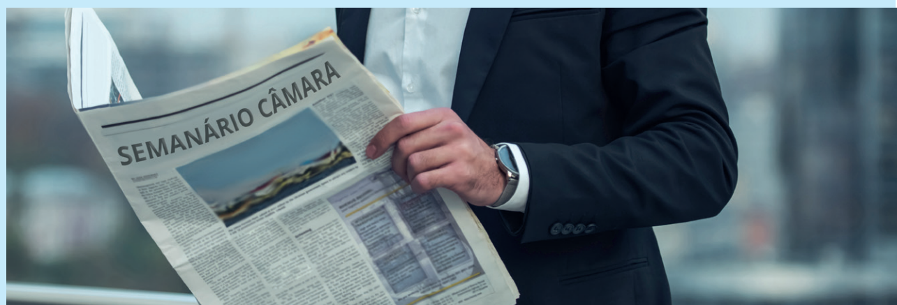
O Semanário também está disponível em formato digital no site da câmara: camaraavare.sp.gov.br

interativa, intuitiva e didática, ficar por dentro de toda a estrutura do legislativo, como tramita um projeto de lei, os direitos e deveres do vereador, entre outras informações e curiosidades.