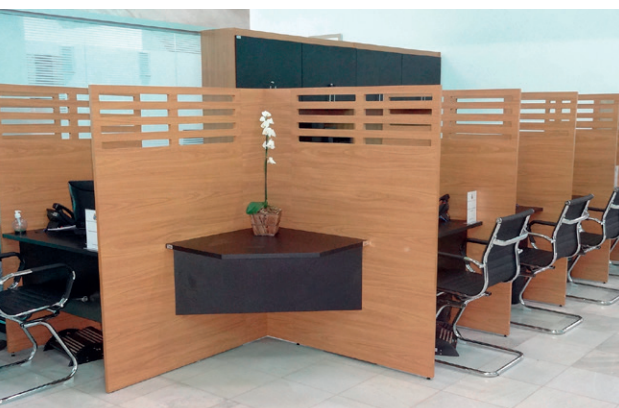
A reforma garantiu mais privacidade aos vereadores e aos munícipes

A pintura externa e interna do prédio para melhorar a estética e preservar a estrutura física das instalações do legislativo. As obras estão em pleno vapor.