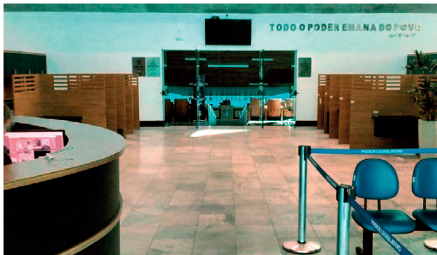
Antes os gabinetes eram tipo "telemarketing"

As obras de reforma e construção dos gabinetes em que proporcionou mais privacidade ao vereador e aos munícipes durante o atendimento.