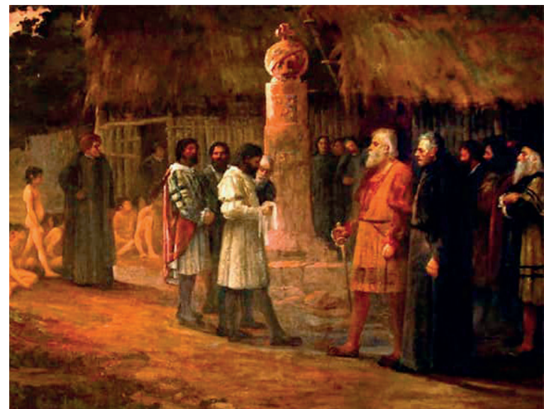
Formação da Câmara Municipal de São Paulo

“Algumas Câmaras funcionavam também como prisões, e exerciam funções que na atualidade competem ao Ministério Público - além de desempenhar serviços de natureza administrativa, policial ou judiciária.”