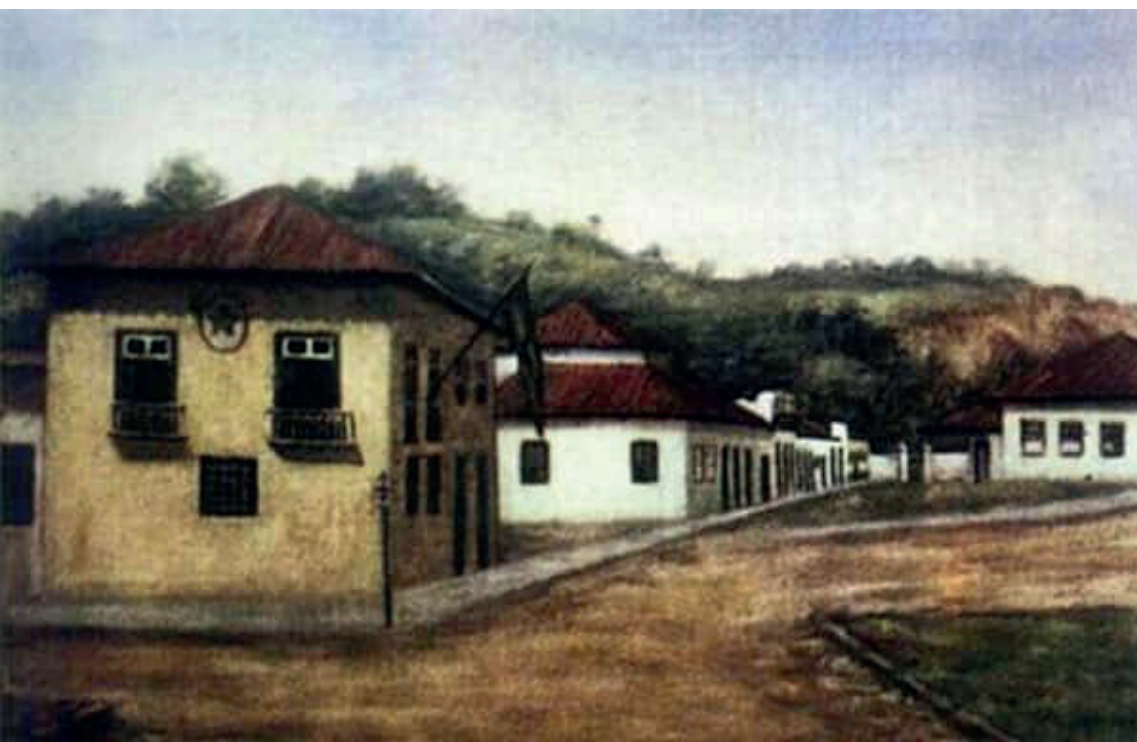
Câmara Municipal e Cadeia, São Vicente, 1729. Pintura a óleo de Gertrudes Hourneaux de Moura Fernandes

O próprio rei, muitas vezes, sancionou abusos cometidos pelos representantes municipais através do poder local (Câmara) contra a