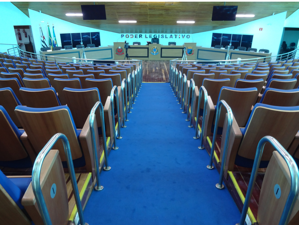
Plenário da Câmara Municipal da Estância Turística de Avaré

Um pouco da história da casa do legislativo avareense